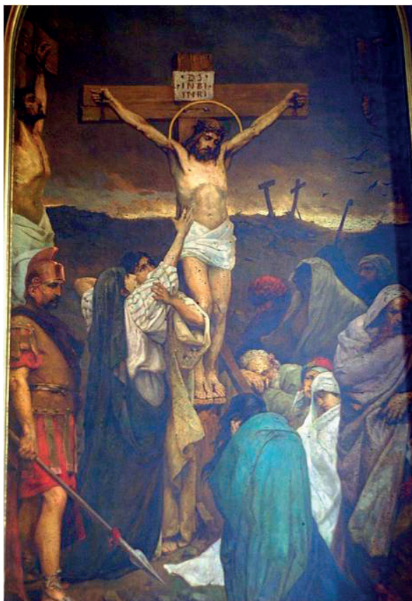
Il. 5. Wilhelm Kotarbiński, Paweł Swiedomski, Ukrzyżowanie , 1894–1895, nawa boczna soboru św. Włodzimierza w Kijowie, fot. M. Goch

realizacją „wiązano w sztuce rosyjskiej odrodzenie malarstwa monumentalnego”. 16