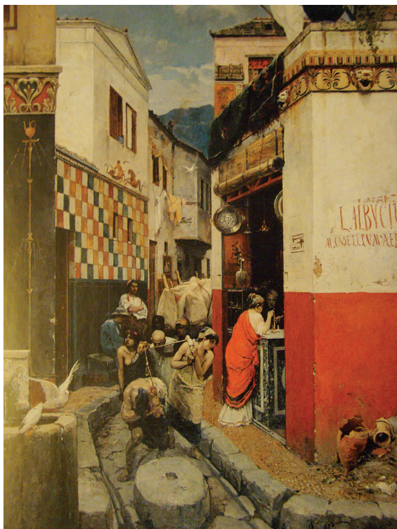
Il. 1. Aleksander Swiedomski, Ulica w Pompejach , 1882, Galeria Trietiakowska w Moskwie, nr inw. 1843, fot. M. Goch