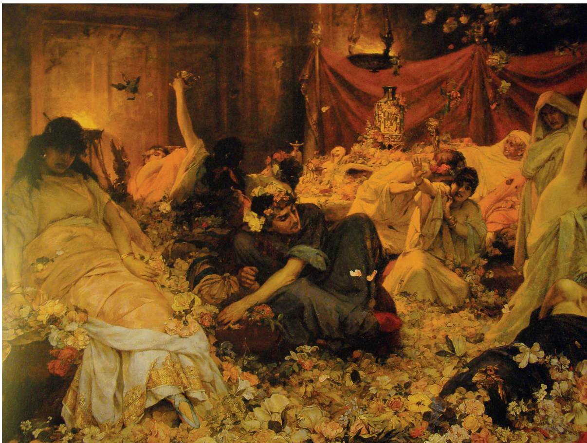
Il. 3. Paweł Swiedomski, Pochowani w kwiatach , 1886, Kijowskie Muzeum Sztuki Rosyjskiej, nr inw. Ж-264

krotnie podkreślali jego zamiłowanie do efektów światłocieniowych: „(...) Świat przedstawia mu się w postaci plam kolorowych, bardzo barwnych, w harmonijną zlewających się gamę”. 11