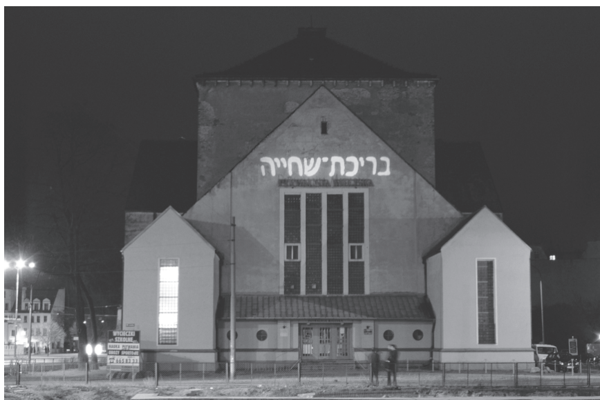
Pływalnia , projekcja świetlna na elewację budynku, Pływalnia Miejska ul. Wroniecka 11a, Poznań, 4 kwietnia 2003 roku Dzięki uprzejmości artysty.

Podczas gdy Janicka dokumentuje pielgrzymki do miejsc, które zostały wyodrębnione jako specjalne miejsca pamięci, pozostałe dwa przykłady dokonują bezpośredniej interwencji w przestrzeń publiczną.