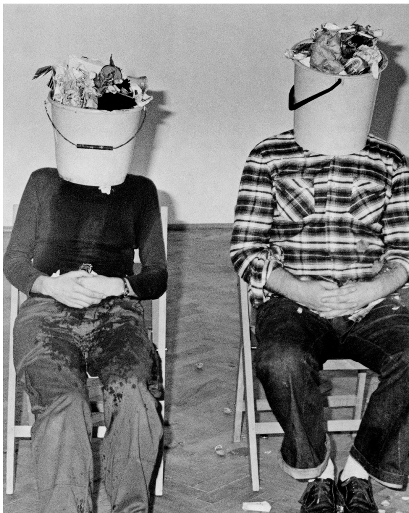
Autor KwieKulik.

firma. Duet – by wybrnąć z konieczności symbolicznego rozdzielania się przy tworzeniu autoportretu, dokonał charakterystycznego podziału 29 . Kwieka – jako potencjał męski – reprezentował rysunek wtyczki z wyraźnie zaznaczonym kształtem bolca. Kulik – potencjał kobiecy – obrazowało