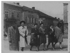
Uczestnicy zjazdu w 10-lecie matury na wadowickim rynku 16 lipiec 1948r.