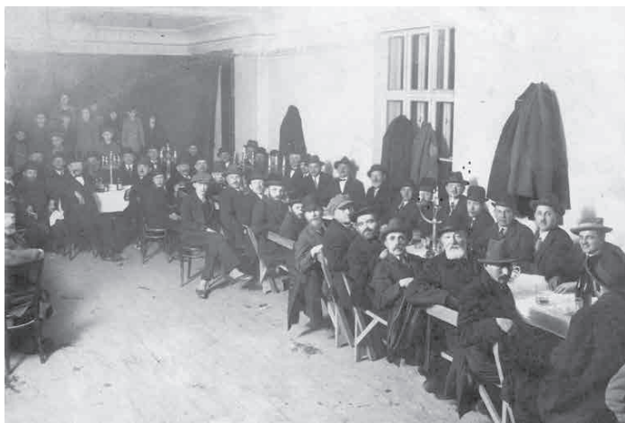
Członkowie andrychowskiej gminy żydowskiej uczestniczący w spotkaniu zorganizowanym w budynku kahalnym.

„Kolumnę dziewcząt żydowskich wysłali Niemcy na wieś aby tam porządkowały domy na przyjęcie niemieckich osiedleńców. Dziewczęta te nawet przy pracy nie traciły humoru, przyśpiewywały sobie, z wartowników Niemców delikatnie sobie drwiły, a przed portretami fuhrera stawiały flakony z kwiatami bo czego innego nie mogły uczynić zbrodniarzowi” (30.12.1964 - data zapisu).