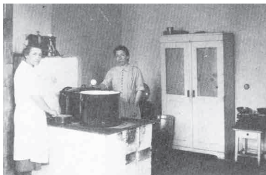
Wspólna kuchnia w andrychowskim getcie.

Krzyża przy okazji podobnych wizyt w Auschwitz. Getto było właściwie otwarte pilnowane przez samych Żydów. Przekonani byli, że wewnętrzna dyscyplina, solidna praca dadzą im poczucie przetrwania. Zasada ocalenia przez pracę tu się Niemcom sprawdzała. Stąd pomimo otwartego getta ucieczek właściwie nie było. Niemcy