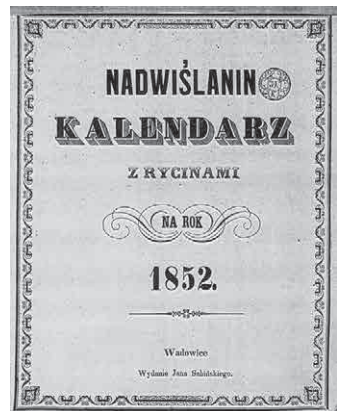
„Nadwiślanin. Kalendarz z rycinami na rok 1852”, Wadowice 1851 BJ 6203 II

Pierwszym nadskawińskim kalendarzem świeckim był wydany przez Jana Sabiniego kilkudziesięciostroniowy „Nadwiślanin. Kalendarz z rycinami na rok 1852” (rok druku: 1851) – jeden z jego egzemplarzy odnajdziemy w Bibliotece Jagiellońskiej (dalej: BJ). Kolejne kalendarze, liczące mniej więcej tyle samo stron, a więc zaliczane do grona wydawnictw książkowych, ujrzały światło dzienne wychodząc spod pras Jo-