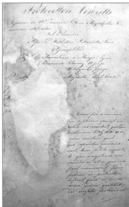
Akta miasta Wadowic, Stronica z księgi protokołów posiedzeń magistratu miasta Wadowic z 1934 r. (APO sygn. 16-133-1-2).

Aby uczynić zadość postawionemu sobie zadaniu związanemu z opisaniem materiałów archiwalnych pozostałych po: instytucjach miejskich, powiatowych czy okręgowych, korporacjach zawodowych, zakładach przemysłowych,