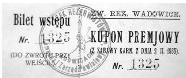
Plakaty, ogłoszenia i ulotki drukowane, Bilet wstępu na reprezentacyjną zabawę karnawałową z okazji 5-tej rocznicy założenia i działalności Związku Rezerwistów na terenie powiatu wadowickiego z 1935 r. (APO sygn. 16-154-4319b).

bankach, szkołach czy w końcu pojedynczych mieszkańcach Wadowic, wytypowano do zaprezentowania prawie 80 zespołów archiwalnych przechowywanych w zasobie Archiwum Państwowego w Katowicach Oddział