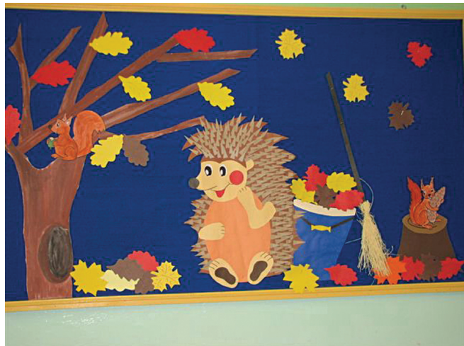
Fot. 4. Integracja muzyczno-plastyczna.

Piosenka w metrum \frac{2}{4} , składa się z 16 taktów w rytmie ósemkowym, o charakterze pogodnym. Jest w tonacji C-dur. Do interpretacji piosenki Jeż zastosowano metodę pracy grupowej, polegającą na tym, że wszyscy uczestnicy brali udział w przygotowaniu dekoracji — jedna grupa dzieci przygotowywała szablon liści, część dzieci malowała farbami