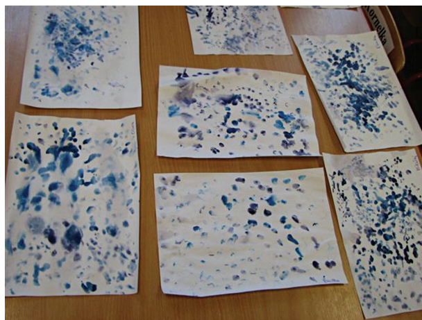
Fot. 5. Integracja muzyczno-plastyczna.

W zabawie plastycznej dzieci miały interpretować krople deszczu. W rytm śpiewanej piosenki dzieci „rysowały” paluszkami pomalowanymi niebieską farbą plakatową ślad padających kropeł na mokrej kartce. Stąd niektóre kropelki są wyraziste, z dobrze widocznym śladem, a niektóre rozmyte wodnym wzorem. Część dzieci posługiwała się tylko dwoma wskazującymi palcami prawej i lewej ręki — na rysunku jest mniej kropeł, a pozostałe z pasją i zapamiętaniem zostawiło ślad każdego palca — na tych kartkach spadło zdecydowanie więcej deszczu. (Podczas mycia rąk w łazience przedszkolnej brzmiała piosenka).