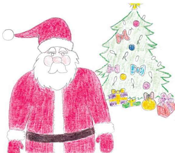
Fot. 2. Wytwory plastyczne dzieci.

wająco zadawać pytania swoim kolegom, np. jakie niespodzianki chcieliby otrzymać pod choinką? Odpowiedzi też były muzyczne. Dzieci ilustrowały ruchem „różne prezenty — niespodzianki”. Podczas śpiewania piosenki wykonywanie były ilustracje plastyczne, zadania z origami — mikołajki, choinki, sanki.