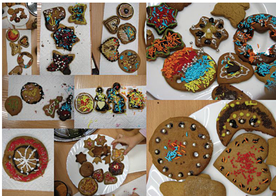
Fot. 1. Prace dzieci przedszkolnych inspirowane muzyką.

Aby utrwalić kolorowe pierniczki, na zajęciach plastyczno-technicznych dzieci mogły przygotowywać różne kształty pierników i dekoracje. Najczęściej pojawiały się pierniki z poznanej piosenki — w kształcie serduszka, księżycy, dzwoneczka, gwiazdki, choinki. Do dekoracji pierniczek dzieci zastosowały bogate kolorystycznie gotowe koraliki, posypki o różnym kształcie — kresczek, kuleczek, spiralek. Pozwoliło to dzieciom na różnorodne i kolorowe użycie „rysunków” z dbałością o dobrą kolorystykę, rytmiczność, symetrię podkreślającą także kontury pierników — okrągłe, w kształcie serduszka, jak i również mogące i mające przypominać dzieciom nuty (fot. 1).