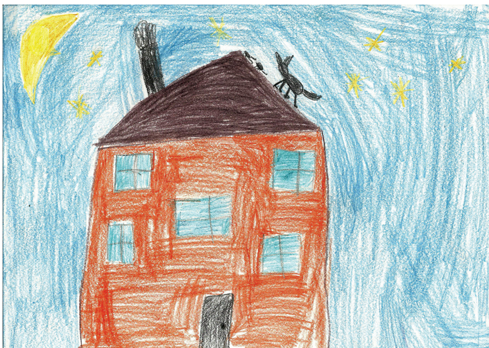
Fot. 3. Praca plastyczna inspirowana muzyką.

Charakter melodii wskazuje na tajemniczość, zaciekawienie. Podczas słuchania linii melodycznej piosenki dzieci z dużym zainteresowaniem naśladowały śpiące koty, które skradały się „jak koty”.