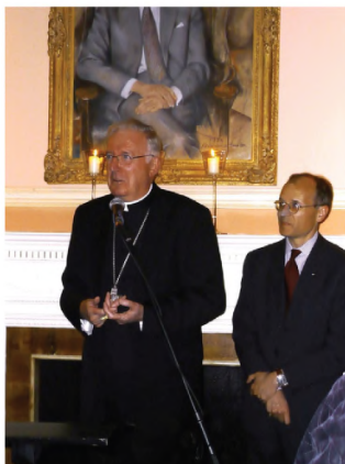
Przemawia kard. Cormac Murphy-O'Connor, abp Westminsteru