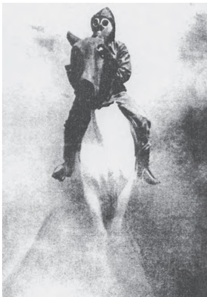
Fot. 2. Atak gazowy. Poligon doświadczalny chemicznych zakładów „Auer”, 1932 rok