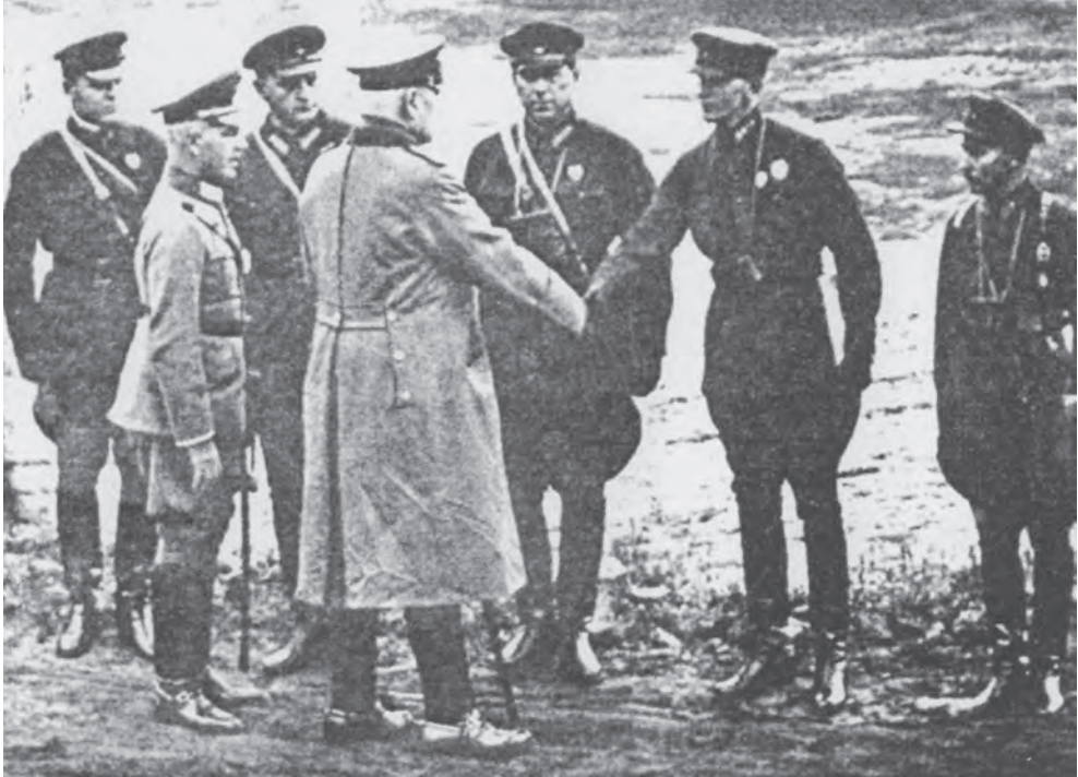
Fot. 4. Prezydent Niemiec Hindenburg wita się z delegacją Armii Czerwonej na manewrach w Niemczech. Drugi z lewej – Tuchaczewski, 1932 rok

uzupełniające studia w ZSRR przechodzili niemieccy dowódcy, m.in. Walter Model, Walter Brauchitsch, Wilhelm Keitel, Erich von Manstein.