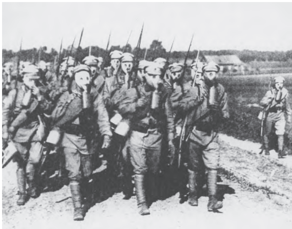
Fot. 3. Przygotowanie do odparcia ataku gazowego, 1929 rok