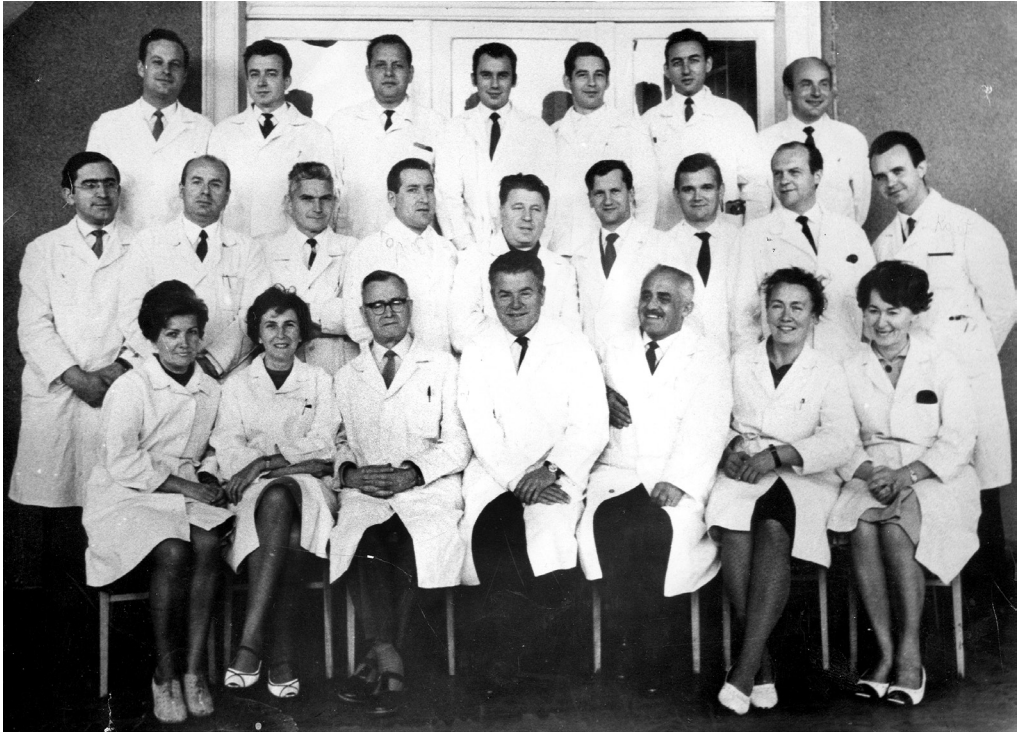
Zespół I Kliniki Chirurgii AM w Poznaniu (ok. 1970 r.).