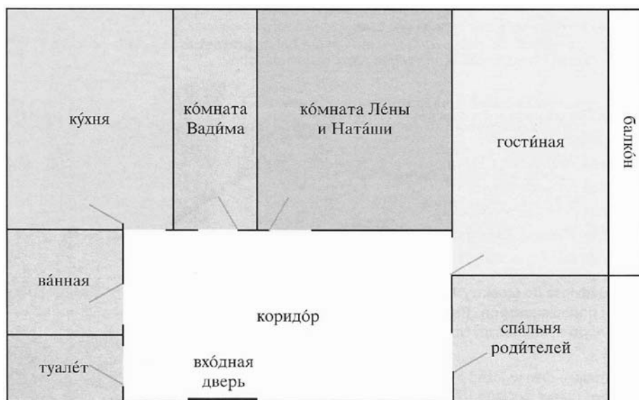
Rys. 1. Część wizualna omawianego ćwiczenia percepcji leksyki

Wybór takiej leksyki potwierdzają słowniki tematyczne [Rieger, Rieger 2003; Морковкин 2003]. Oznacza to, że omawiane leksemy są bezpośrednio związane z precyzowanym zakresem tematycznym. Jeśli byłyby to słowa z rozmytym znaczeniem, nie zostałyby wpisane w ramy danego tematu. Ale już zaproponowane w omawianym schemacie połączenie wyrazowe входная дверь nie figuruje w słownikach; rzeczownik дверь jest dookreślany jedynie poprzez wyrażenia: в коридор , в комнату , на лестницу , балкон , дверь-купе , a także глазок , почтовый ящик [Rieger, Rieger 2003] 7 . Jednak niezależnie od faktu, że słowniki tematyczne opierają się na statystycznych danych odnośnie do użycia języka, to jednak nie są one obliczone na stopień zaawansowania językowego docelowego audytorium. Dlatego też uzasadnione wydaje się odwołanie się do słownika częstotliwości użycia słów [Морковкин 2003: 599–744]. Wskazane opracowanie klasyfikuje wyrażenia na 10 poziomach, obejmujących odpowiednio od 500 do 5000 najczęściej używanych słów w języku rosyjskim. Szacuje się, że przeciętny użytkownik języka