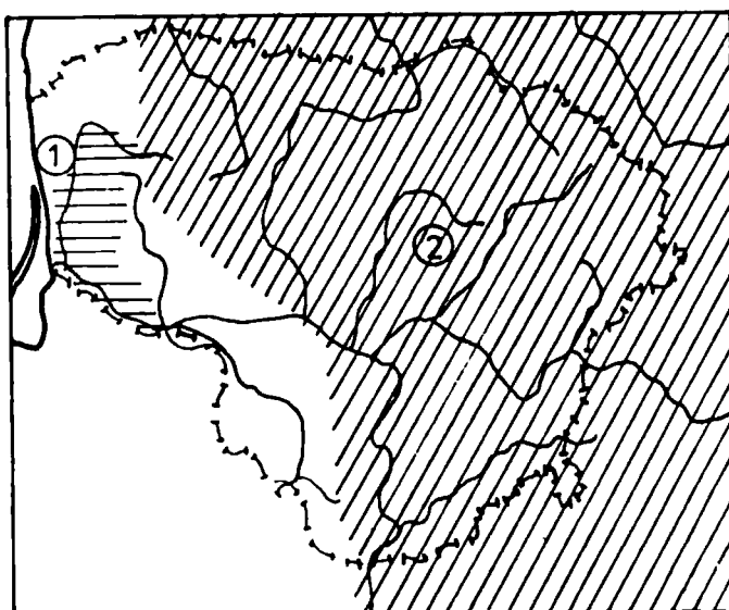
Рис. 1. Территория Литвы на рубеже нашей эры (по: А. З. Тауавичюсу)

бальные памятники отсутствуют. Границы между отдельными культурами лесной полосы прослеживаются плохо. С юга к этим культурам примыкает милоградская, которая занимает как бы среднее положение между культурами лесной полосы, культурами скифского типа и лужицко-поморского круга. В милоградской культуре было более развитое земледелие и скотоводство, известны грунтовые и курганные могильники. Однако, структура поселений и сам стиль культуры был приблизительно таким же, как и в лесной полосе. Определенная унификация, относительная идентичность и синхронность цикла развития позволяет все эти культуры рассматривать в качестве единого культурного круга лесной полосы.