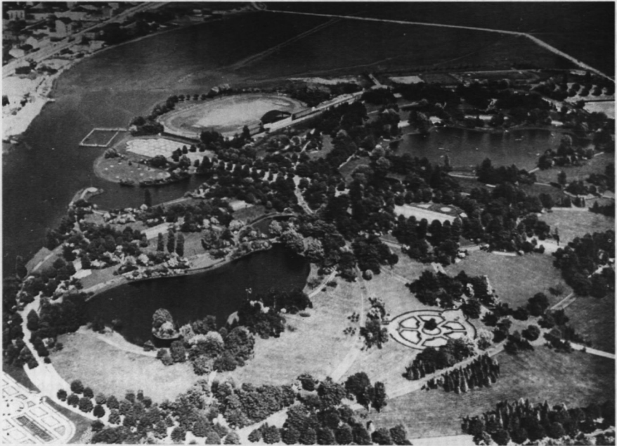
11. Park Skaryszewski im. I. J. Paderewskiego, zdjęcie lotnicze, 1934 r.

Znaczną część Saskiej Kępy w dalszym ciągu stanowią tereny zielone. Północną stronę alei Waszyngtona zajmują: wybudowany na miejscu dawnych gospodarstw Stadion Dziesięciolecia (1955 r.) 89 i Park Skaryszewski im. I. J. Paderewskiego. Park powstał na dawnych pastwiskach skaryszewskich w latach 1905–1922 (rozbudowany w 1928 r.), obejmując obszar między aleją Zieleniecką, Jeziorkiem Kamionkowskim, obecną ulicą Międzynarodową a aleją Poniatowskiego. Jego wielkość (58 ha) i precyzję kompozycji można podziwiać na zdjęciu lotniczym z 1934 r. 90 Pocztówki, albumy, fotografie artystyczne dotyczące parku stanowią w Dziale Ikonografii pokaźny zbiór. Wspaniale grupy drzew, pełne uroku ogrody kwiatowe, „dzikie” stawy, grotta z wodospadem – są tematem wielu zdjęć H. Poddębskiego, K. Wojtuńskiego, F. Gazdy oraz albumu o dużych walorach artystycznych, autorstwa Zygmunta Stan-