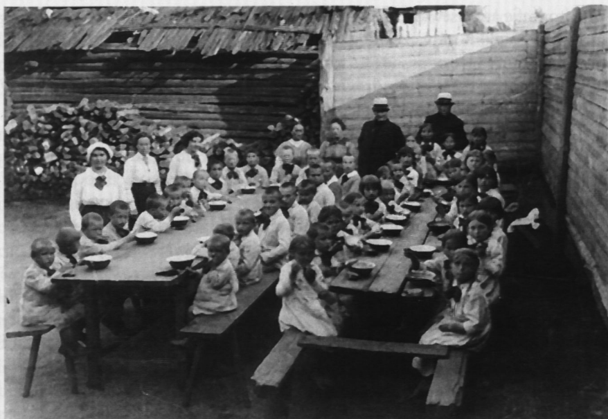
3. Ochronka dla dzieci (okolice ulicy Kawęczyńskiej). okres międzywojenny

ledwie 137, z czego znakomitą większość stanowią zdjęcia nowo otwartego ZOO 13 i pejzaże Parku im. I. J. Paderewskiego 14 .