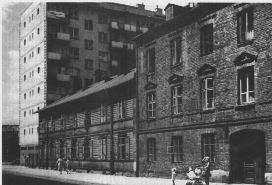
12. Ulica Strzelecka.