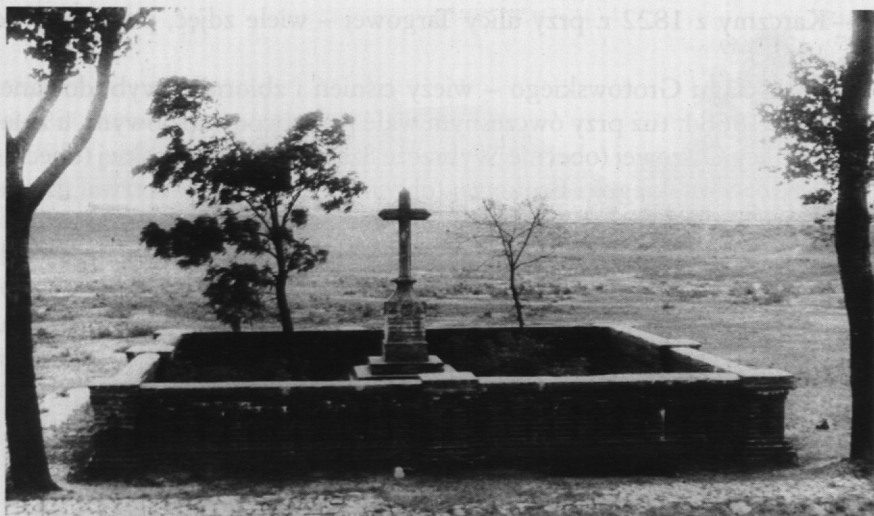
6. Pamiątkowy krzyż z 1908 r. postawiony na dawnym cmentarzu cholerycznym. okres międzywojenny

pogrzebu zmarłych na cholere 45 (w październiku 1892 r. wydzielono specjalną kwaterę). Ostatni cmentarz choleryczny na Pradze zlikwidowano po wybudowaniu kolei nadwiślańskiej, stawiając na jego miejscu kamienny krzyż w 1908 r., którego zdjęcia znajdują się w zbiorach Działu Ikonografii 46 .