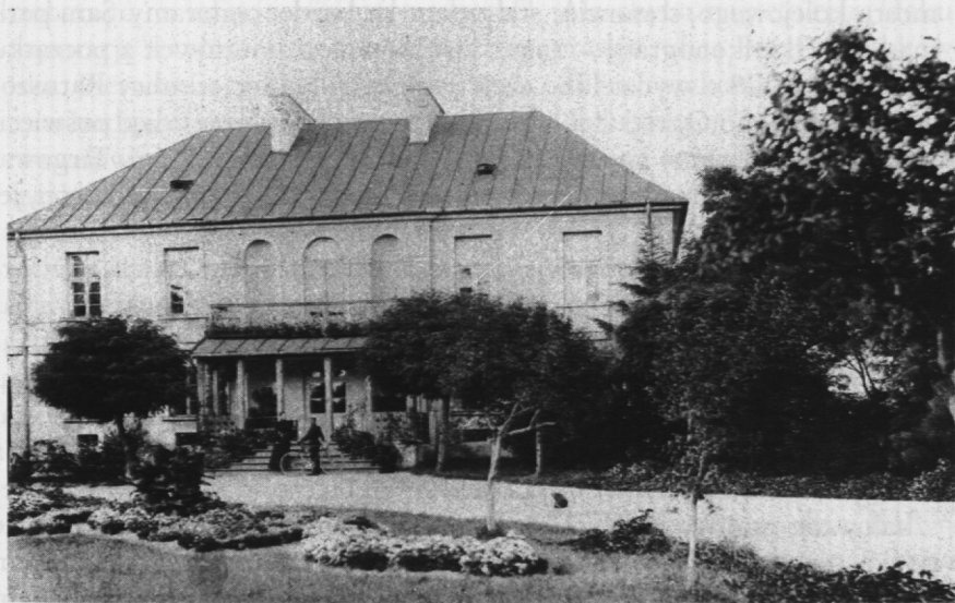
8. Pałacyk Osterloffów, ulica Grochowska. Fot. nieznanymi, 1912 r.

przestrzenie, pojedyncze domy, stary targ koński. Tak wyglądało to miejsce jeszcze na początku XX w. Zdjęcia wykonane z tego samego budynku w kierunku przeciwnym ukazują starą zabudowę ulic Olszowej, Błaszannej, Panińskiej, Szerokiej. Są to dawne budynki wojskowe: koszary Weichanowskie, magazyny i składy wojskowe, odwach, zabudowania tymczasowego szpitala praskiego 52 . Późniejsze widoki, z lat 1910–1915, ulicy Aleksandrowskiej (w okresie międzywojennym Zygmuntońskiej, obecnie Jagiellońskiej) przedstawiają zagęszczającą się zabudowę wokół kościoła, kamienice mieszkalne na miejscu dawnego targu i gmach szkolny późniejszego gimnazjum, a obecnie Liceum Ogólnokształcące nr VIII im. Władysława IV, z charakterystyczną wieżą zegarową 53 . Przy uregulowanym w 1926 r. placu Weteranów 1863 r. wybudowano w 1934 r. nowy gmach Szpitala Przemienienia Pańskiego, podkreślający swą półkolistą fasadą kształt placu 54 . Po przeciwnej stronie ulicy Aleksandrowskiej już w 1871 r. otwarto dla publiczności Park Praski (do 1916 r. zwany Aleksandryjskim), który ciągnął się wzdłuż wybrzeża, prawie do