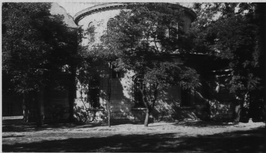
5. Ulica Szeroka – synagoga. 1918 r.

Stare praskie cmentarze pojawiają się na fotografiach dopiero w latach czterdziestych XX w. (serie zdjęć L. Sempolińskiego), z wyjątkiem cmentarza Bródnowskiego. Ten ostatni, założony w 1884 r., początkowo przeznaczony tylko dla mieszkańców Pragi, a od 1885 r. dla mieszkańców całej Warszawy, sfotografowany został przez Konrada Brandla w 1892 r. (brama cmentarna i główna aleja) przy okazji zbiorowego