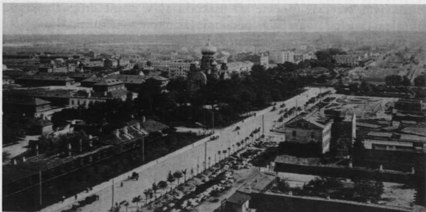
4. Panorama Pragi z kościoła Św. Floriana, pocztówka, ok. 1900 r.

Św. Floriana. Zbudowany w latach 1888–1904, swą wykonaną z surowej cegły neogotycką fasadą i pięknymi, wysokimi wieżami wyróżniał się szczególnie, dominując w większości panoram Pragi. Ma bardzo bogatą ikonografię (głównie na pocztówkach) rejestrującą zmiany, jakie zachodziły w wyglądzie kościoła i jego otoczenia. Pierwsze zdjęcia zostały zrobione przez Konrada Brandla, gdy kościół był jeszcze w budowie w 1897 r. 38 , podczas uroczystości powitania pary cesarskiej w Warszawie. W następnych latach gęstniała zabudowa wokół i na tyłach świątyni, a po 1930 r., kiedy to skrócono grożące zawaleniem wieże, zmienił się sam kościół 39 . Zdjęcia gigantycznego rumowiska i fragmentu jedynej ocalałej ściany, po wysadzeniu go w powietrze przez Niemców w 1944 r., to najbardziej dramatyczne ujęcia z Pragi 1945 r. 40