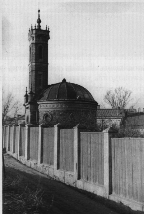
7. Wodozbiór z wieżą ciśnień Grotowskiego z 1868 r. Fot. H. Poddębski, 1937 r.

Istotnym źródłem do badania dziejów miasta są widoki fotograficzne ulic, pokazujące rodzaje zabudowy i zachodzące w niej zmiany, ruch uliczny, rozwijającą się komunikację miejską, wreszcie wydarzenia, które stanowiły o dniu codziennym mieszkańców. W zbiorach Muzeum znajduje się ikonografia dla całego omawianego okresu, przede wszystkim znaczących ulic Pragi centralnej, Nowej Pragi i Szmulowizny. Tereny Kamionka i Grochowa, a właściwie głównej ulicy – Grochowskiej prezentują zdjęcia (poza kilkoma) powojenne i współczesne. Natomiast Pelcowizna, Bródno, Targówek, daleki Grochów i Goćław są jedynie na zdjęciach z lat siedemdziesiątych.