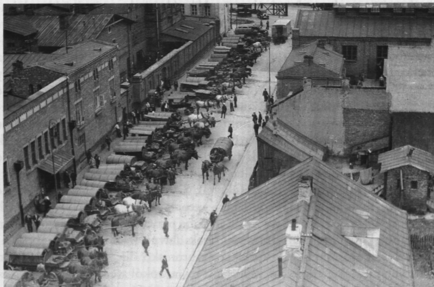
9. Ulica Namiestnikowska – rzeźnia miejska. okres międzywojenny

Budowy Rektyfikacji pokazujące fabrykę spirytusu z 1897 r., zdjęcia fabryki maszyn młyńskich C. Skoryny z 1918 r. 67 , fabryki elektrotechnicznej braci Borkowskich (ulica Grochowska) z 1922 r. 68 , mechanicznej piekarni S. Wiechowicza (ulica Stolarska) 69 , rzeźni miejskiej przy ulicy Namiestnikowskiej 70 i fabryki „Wedla” z 1947 r. 71