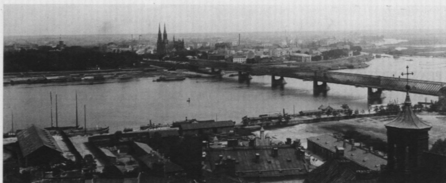
1. Widok na Pragę. Fot. Z. Marcinkowski, 1912 r.

specyficzny charakter. Silne zubożenie mieszkańców (ludność zamożna przeniosła się do lewobrzeżnej Warszawy), niepewność jutra, częste powodzie – wszystko to nie sprzyjało rozwojowi budownictwa. Dominowała zabudowa tymczasowa – drewniana. Budowa w 1833 r. Fortu Śliwickiego, a w 1886 r., w ramach systemu fortecznego okalającego Warszawę, fortu nr XI i prochowni na Grochowie, wiązały się również ze znacznym ograniczeniem budownictwa. Zakaz wznoszenia budynków murowanych na terenie esplanady i w pasie fortecznym obowiązujący do 1911 r. spowodował, że Pelcowizna, Targówek, Bródno, północna część Pragi i Grochów pokryły się często zupełnie przypadkową, chaotyczną, drewnianą zabudową 4 .