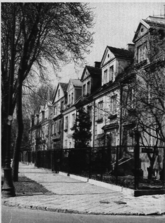
10. Saska Kępa – ulica Obrońców. Fot. E. Pawlak, 1988 r.

ryka Poddębskiego robionych z drugiego brzegu, poprzez zdjęcia z Mostu Poniatowskiego na zabudowę ulicy Walecznych 84 , Wał Miedzeszyński i ulicę Łotewską, aż po te, wykonywane na nabrzeżach. Budynki mieszkalne z jednej strony i drewniane pawilony plażowe z drugiej, to oryginalna zabudowa ulicy Miedzeszyńskiej, która biegła na wale przeciwpowodziowym 85 . Plaże, a było ich kilkanaście, i przystanie na Saskiej Kępie, bardzo popularne w okresie międzywojennym, były wdzięcznym tematem do zdjęć 86 . Kontrasty między długo koegzystującymi ze sobą – współczesną, elegancką zabudową willowej dzielnicy a starymi, drewnianymi, często jeszcze letniskowymi domami – były pieczołowicie wychwytywane przez fotografów 87 . Piękno architektury Saskiej Kępy, prawie nie zmienionej do dziś, możemy podziwiać na zdjęciach Ewalda Pawlaka z 1988 r.; to jedna z niewielu współczesnych serii fotografii w zbiorach Muzeum 88 . Rezydencja przy ulicy Francuskiej 2, dom mieszkalny projektu Syrkusów przy ulicy Walecznych, willa B. Lacherta przy ulicy Katowickiej, drewniany dworek u zbiegu ulic Dąbrówki i Walecznych, stary pomnik ku czci poległych w bitwie o Warszawę w 1656 r., czy wreszcie wielki gmach