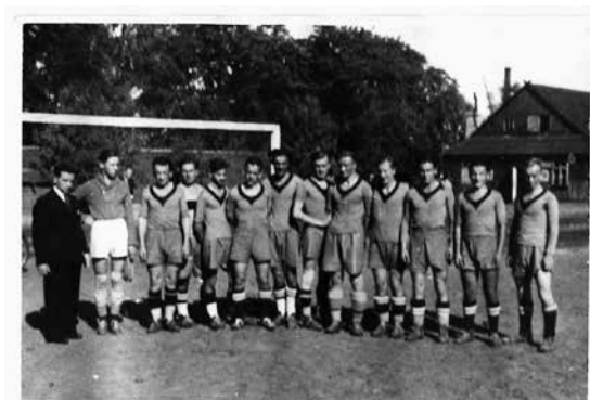
2. Fotografia drużyny piłkarskiej RKS Drukarz w Warszawie 1936–1938

Fotografia drużyny piłkarskiej RKS Drukarz w Warszawie 1936–1938. (Reprodukcja ze zbiorów Centralnego Archiwum przy KC PZPR).