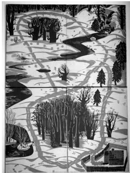
4. Gra planszowa Tropy, około 1946 roku wydana przez spółdzielnię Światowid