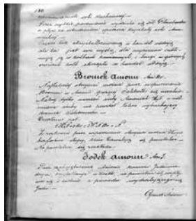
1. Teofil Lesiński, Kurs chemii wykładany..., t. I-II, połowa XIX wieku