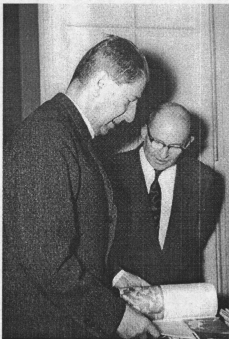
Ryc. 1. Zastępca przewodniczącego Rady Państwa prof. Stanisław Kulczyński przegląda „Problemy”.