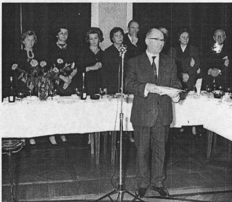
Ryc. 2. Redaktor w otoczeniu pracowników redakcji na uroczystości jubileuszowej.