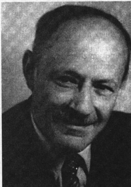
prof. Zygmunt Modzelewski