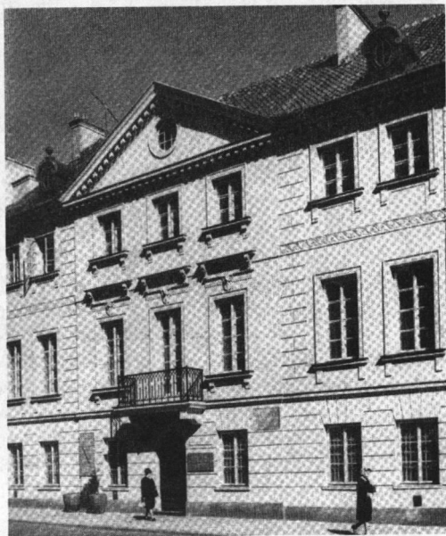
Dom Marii Skłodowskiej-Curie przy ul. Freta 16 siedziba Zakładu Historii Nauki