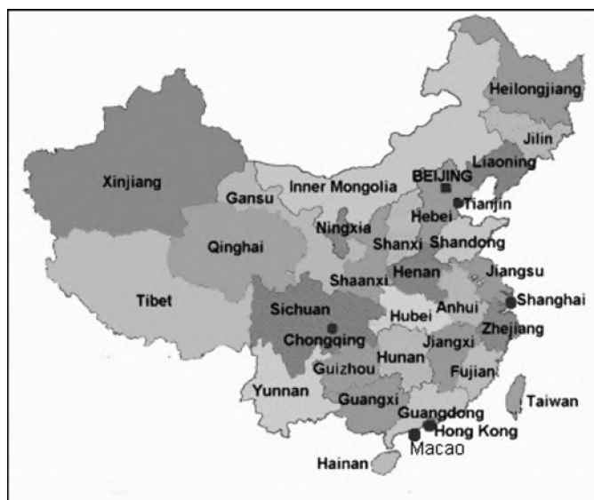
Mapa 1. Prowincje Chin Chinese Provinces

Przedmiotem opracowania jest analiza przestrzennego zróżnicowania rozwoju regionalnego Chin w trzech podstawowych dziedzinach: 1) wielkości i dynamice PKB i PKB per capita , 2) wartości eksportu, 3) udziale prowincji w napływie ZIB. Podstawowym celem artykułu jest określenie stopnia koncentracji potencjału gospodarczego w prowincjach Chin. W opracowaniu zastosowany został podział Chin na dwie grupy zasadniczo różniące się poziomem rozwoju gospodarczego i potencjałem ekonomicznym. Pierwsza obejmuje 10 prowincji wschodnich, leżących wzdłuż wybrzeża: Liaoning, Beijing, Tianjin, Hebei, Shandong, Jiangsu, Shanghai, Zhejiang, Fujian i Guangdong. W drugiej grupie znalazły się pozostałe prowincje. W całym tekście użyto nazewnictwa prowincji zgodnego z transkrypcją pinyin.