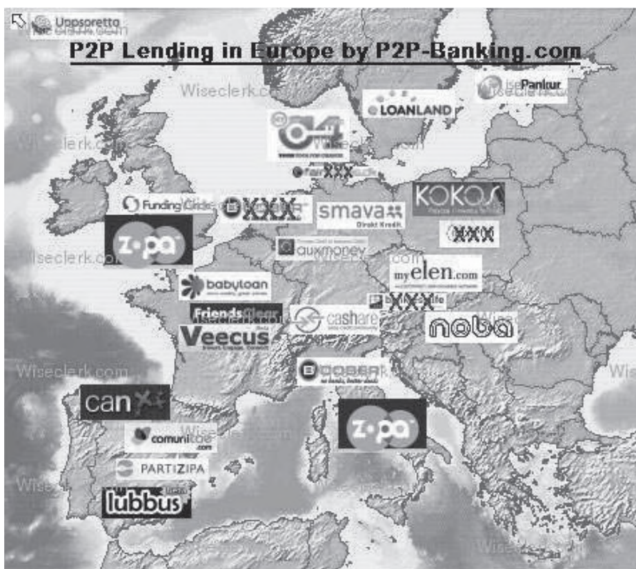
Rysunek 2. Lokalizacja portali pożyczkowych w Europie