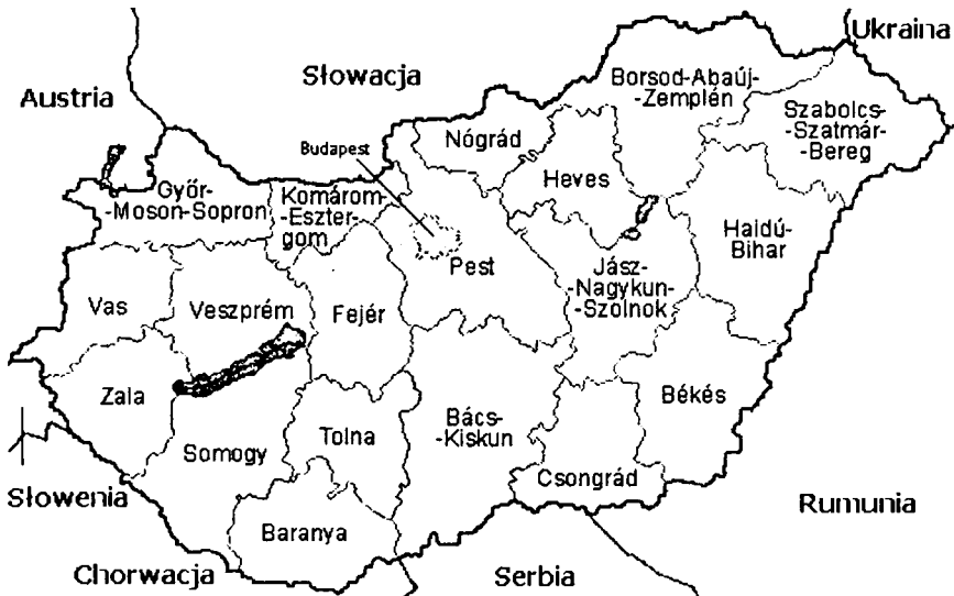
Ryc. 1. Podział Węgier na komitaty

W ramach ustaw samorząd terytorialny realizuje w stosunku własności samorządowej prawa przysługujące właścicielowi, czyli może dysponować swoim mieniem, gospodarować samodzielnie swoimi dochodami. Może także na własną odpowiedzialność prowadzić działalność gospodarczą. Ponadto w sposób niezawisły kształtuje swoją organizację i tryb działania. Konstytucja przewidziała również możliwość swobodnego zrzeszania się jednostek samorządowych w celu reprezentowania interesów wobec organów państwa zarówno centralnych, jak też lokalnych (do najważniejszych stowarzyszeń należą Stowarzyszenie Węgierskich Władz Lokalnych, Federacja Węgierskich Władz Lokalnych, Narodowa Federacja Władz Lokalnych). Lokalny organ przedstawicielski może współpracować z samorządem lokalnym innego państwa, jak też może być członkiem międzynarodowych organizacji samorządowych 7 .