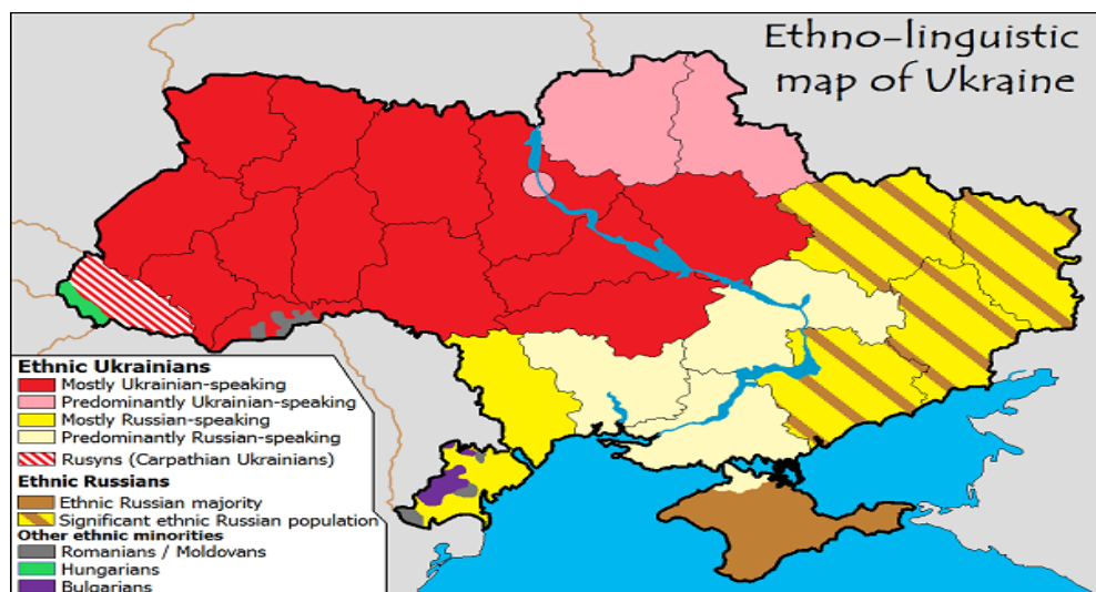
Mapa 1. Etniczno-językowa mapa Ukrainy