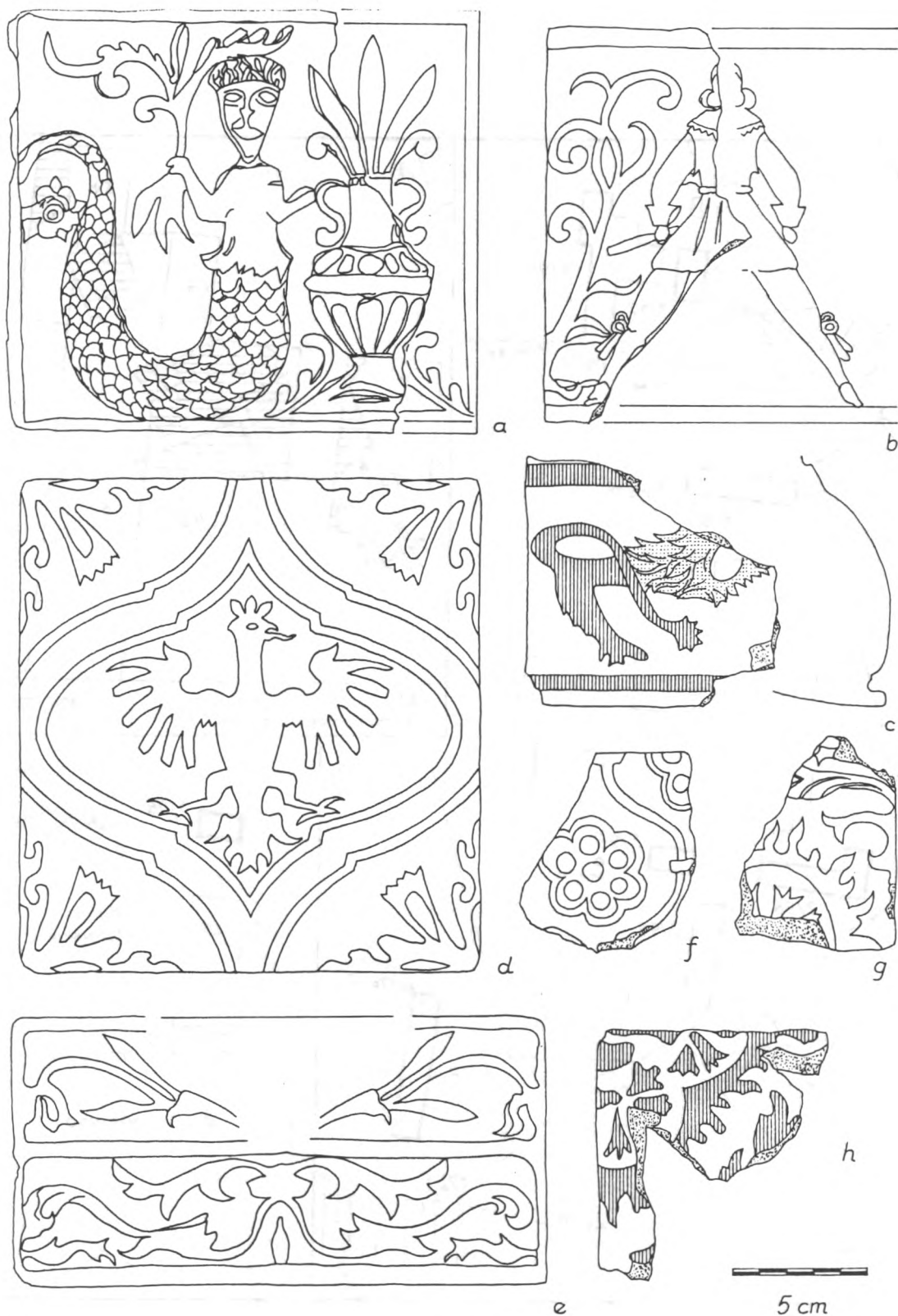
Ryc. 3. Łęczna, stan. 2 - Zamek. Wybór kafli piecowych: a/ z wizerunkiem syreny przy wazonie, bez polewy - wykop 7/97; b/ z przedstawieniem postaci ludzkiej, bez polewy - wykop 7/97; c/ fragment kafla gzymsowego z lwem, polewany: tło białe, tułów, tylna łapa i ogon granatowe, grzywa i przednia łapa żółte, rama biało-granatowa - wykop 2/96; d/ z wizerunkiem orła i kwiatowymi rozetami, bez polewy - wykop 7/97; e/ gzymsowy z ornamentem roślinnym, bez polewy - wykop 6/97; f/ z rozetą kwiatową w obramowaniu ornamentu okuciowego, bez polewy - wykop 7/97; g/ ze stylizowanym ornamentem roślinnym, bez polewy - wykop 6/97; h/ z podobnym zdobieniem, polewany: tło białe, ornament granatowy - wykop 2/96.