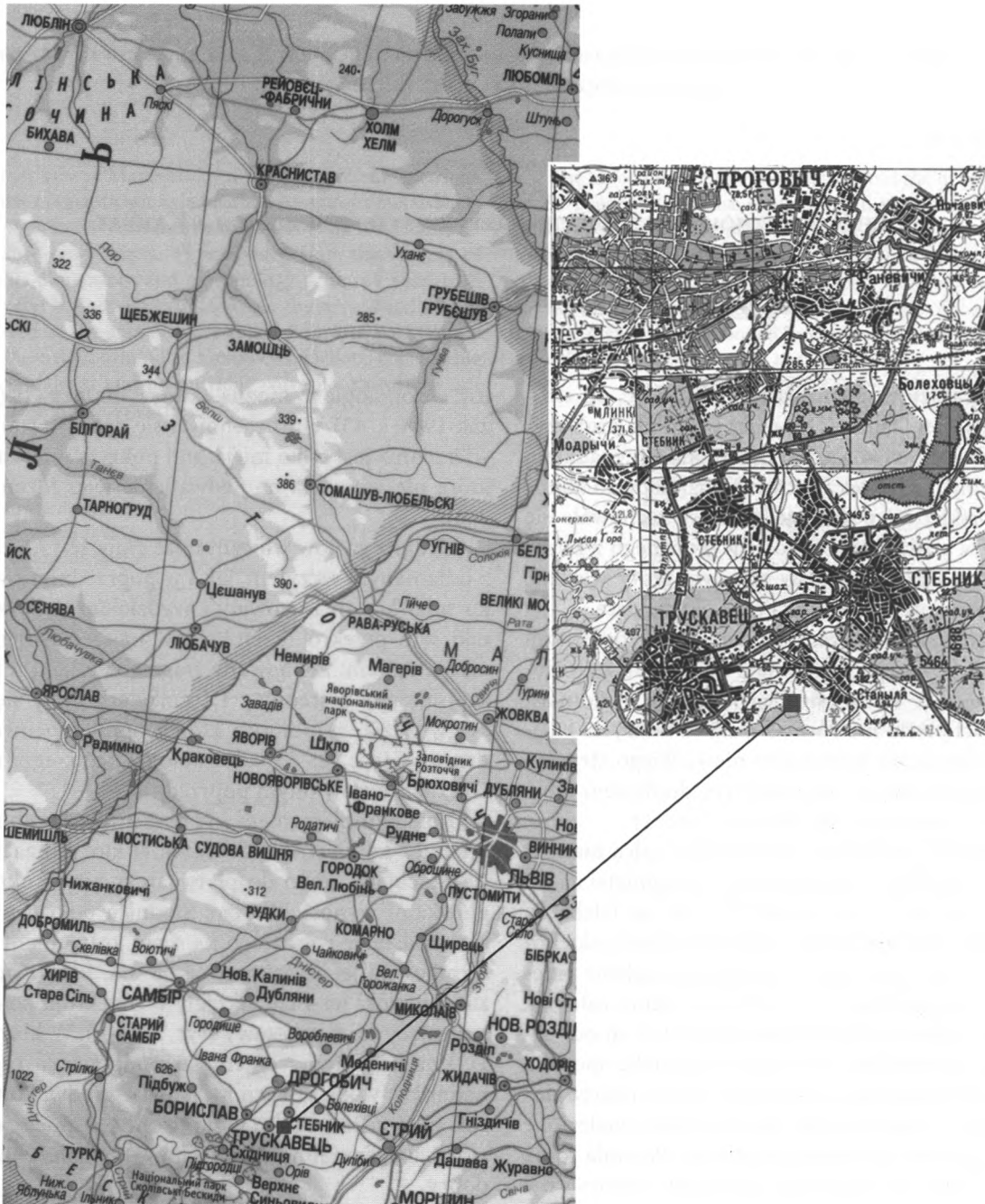
Ryc. 1. Lokalizacja miejsca odkrycia pochówku z Truskawca, obw. Lwów.

szaną skuwkę z otworami na nity średnicy 0,3 cm. Jej kształt odczytano na podstawie zdjęcia rentgenowskiego (ryc. 2: 4). Najbliższa jej analogia pochodzi z grobu odkrytego w Dobrostanach (Добростани) w rejonie jaworowskim, w obwodzie lwowskim (M. Śmiszko 1932, s. 6-7). Egzemplarze takie występują powszechnie w środkowym okresie rzymskim.