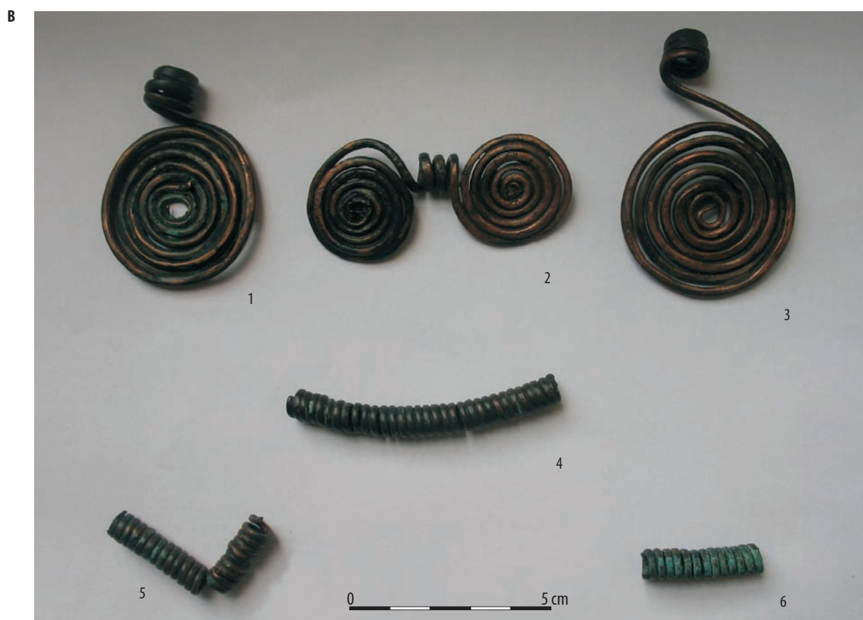
Ryc. 3. Gródek, pow. hrubieszowski, stan. 1C. Ozdoby brązowe: A – stan przed konserwacją; B – stan po konserwacji.