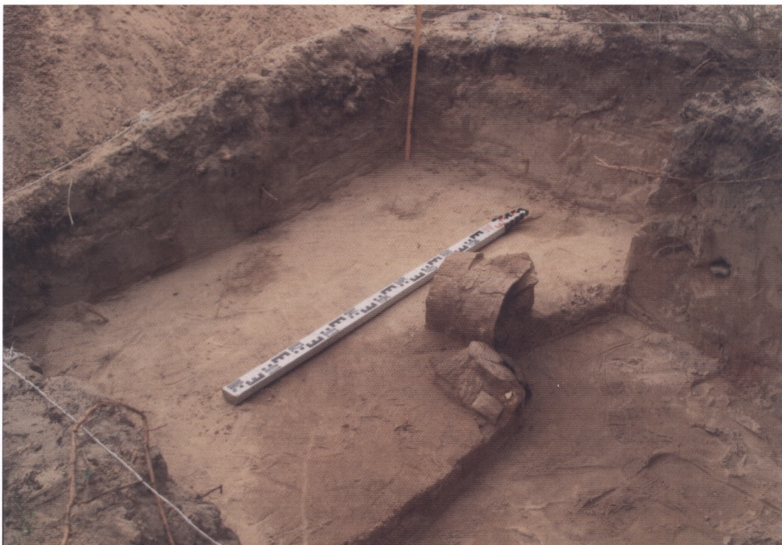
Ryc. 1. Opoczka Mała, pow. kraśnicki. Grób 1 w trakcie eksploracji.