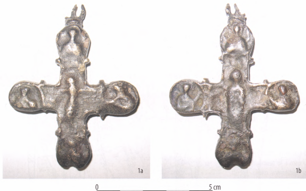
Ryc. 3. Wereszczyn, pow. włodawski. Krzyż: 1a – awers; 1b – rewers.