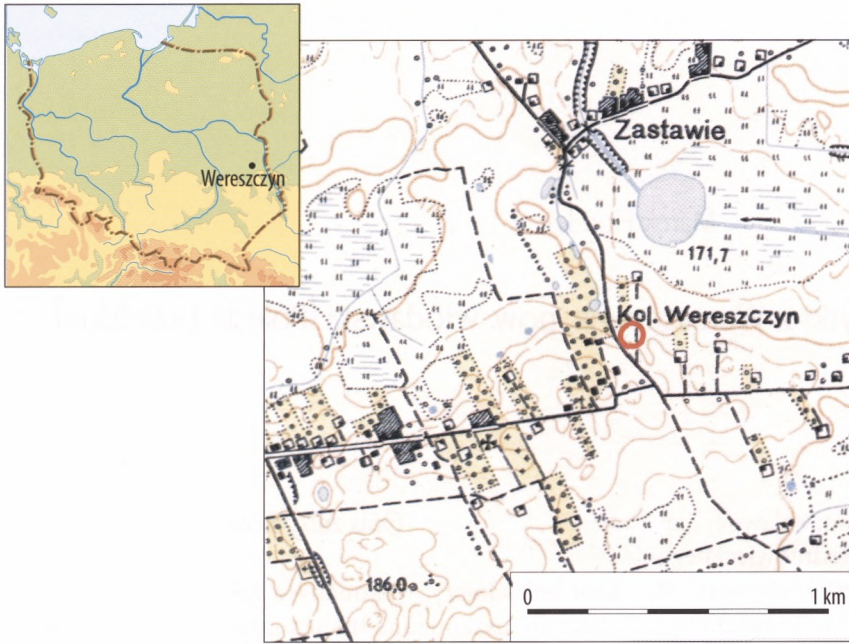
Ryc. 1. Wereszczyn, pow. włodawski. Lokalizacja stanowiska (fragment mapy: Powiat włodawski. Województwo lubelskie, skala 1: 25 000. Wydawca – Zarząd Topograficzny Szt.[abu] Gen.[eralnego]. Warszawa 1962).