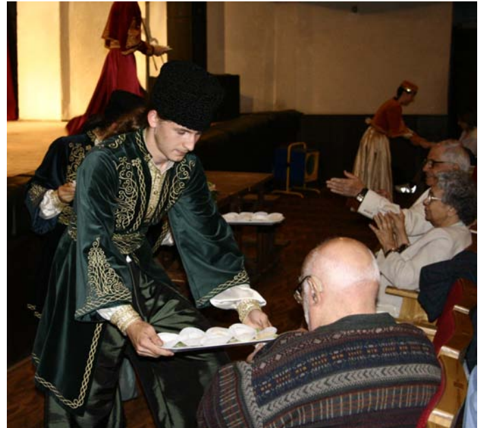
Stupiecz – poczęstunek