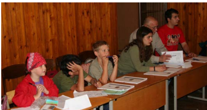
Lekcja języka karaimskiego

A czasu za wiele nie było – ot, niecałe dziesięć dni zajęć, a w dziennym grafiku lekcje języka, akty-