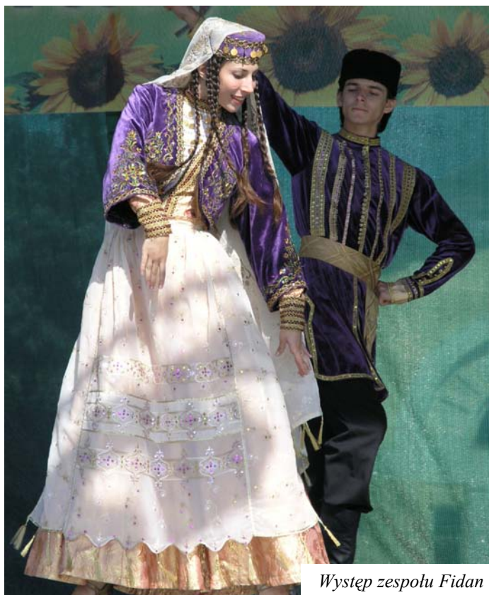
Występ zespołu Fidan