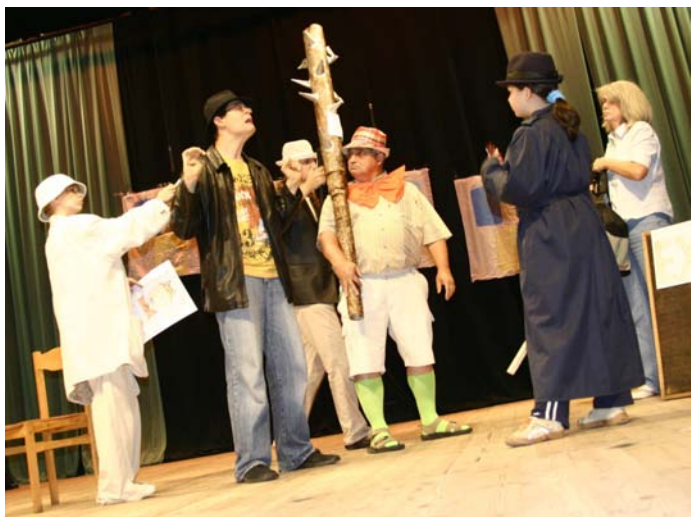
Sherlock Holmes i dr Watson w akcji

Uważnie wsłuchiwno się w karaimską mowę, która płynęła ze sceny. Fantazja uczniom – jak zawsze zresztą – dopisała: najmłodszy uczestnicy brawurowo wykonali piosenkę z musicalu „Dźwięki muzyki”, Iwan Susanin wędrował po mokradłach, pojawili się też karaimscy gangsterzy z Pruszkowa,