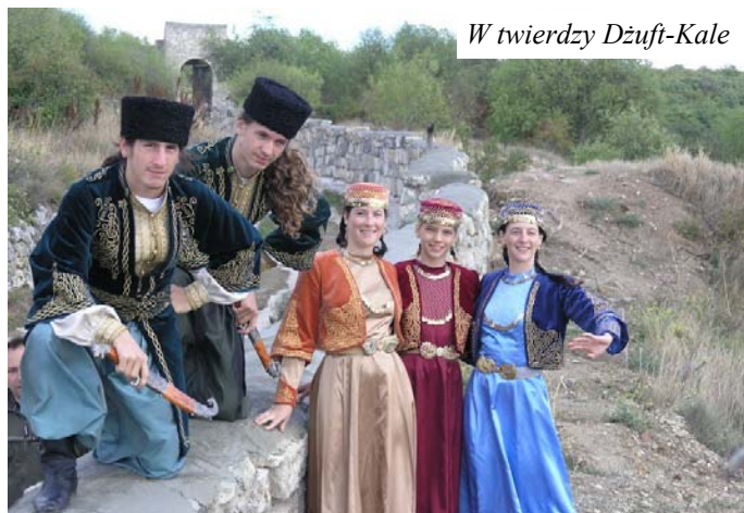
W twierdzy Dżuft-Kale