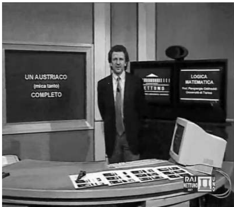
Il. 3. Przykład wykładu na Uniwersytecie NETTUNO 15

NETTUNO to największy z dotychczas zrealizowanych projektów tego typu w Europie i na świecie. Dzięki współpracy ministerstwa edukacji, wielu wyższych włoskich uczelni oraz innych instytucji i przedsiębiorstw powstał modelowy uniwersytet na odległość, który realizuje jeden z najważniejszych pomysłów Komisji Europejskiej, jakim jest stworzenie Europejskiego Wirtualnego Uniwersytetu w ramach projektów Med. Net'U (Mediterranean Network University) oraz LIVIUS (Learning In a Virtual University System) 16 . Ogromny sukces NETTUNO, jako modelowego uniwersytetu na odległość, wynika z zastosowania oryginalnego wzorca psychopedagogicznego oraz olbrzymiego wysiłku organizacyjnego, który pozwolił na wszechstronne wykorzystanie potencjału tkwiącego w najbardziej nowoczesnych i stale rozwijanych technologiach służących również edukacji.