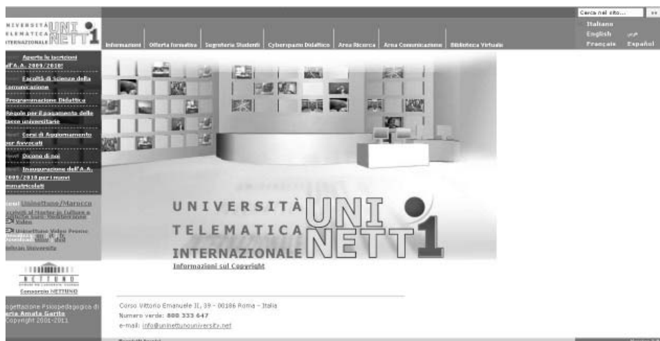
Il. 4. Strona główna uniwersytetu wirtualnego UNINETTUNO 17 . W lewym dolnym rogu widoczna ikona konsorcjum NETTUNO