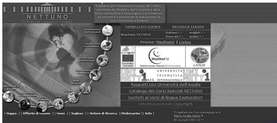
Il. 1. Strona główna konsorcjum NETTUNO 9

NETTUNO było uruchomienie w roku akademickim 2007/2008 studiów uniwersyteckich na odległość w Kairze, we współpracy z miejscowym Instytutem Don Bosco. Dzięki temu umożliwiono studentom egipskim kontynuowanie nauki na poziomie uniwersyteckim w miejscu zamieszkania w języku arabskim, angielskim i włoskim oraz zapewniono uznanie dyplomów w zakresie informatyki, zdobywanych on-line, zarówno przez władze egipskie, jak i przez władze włoskie 8 .