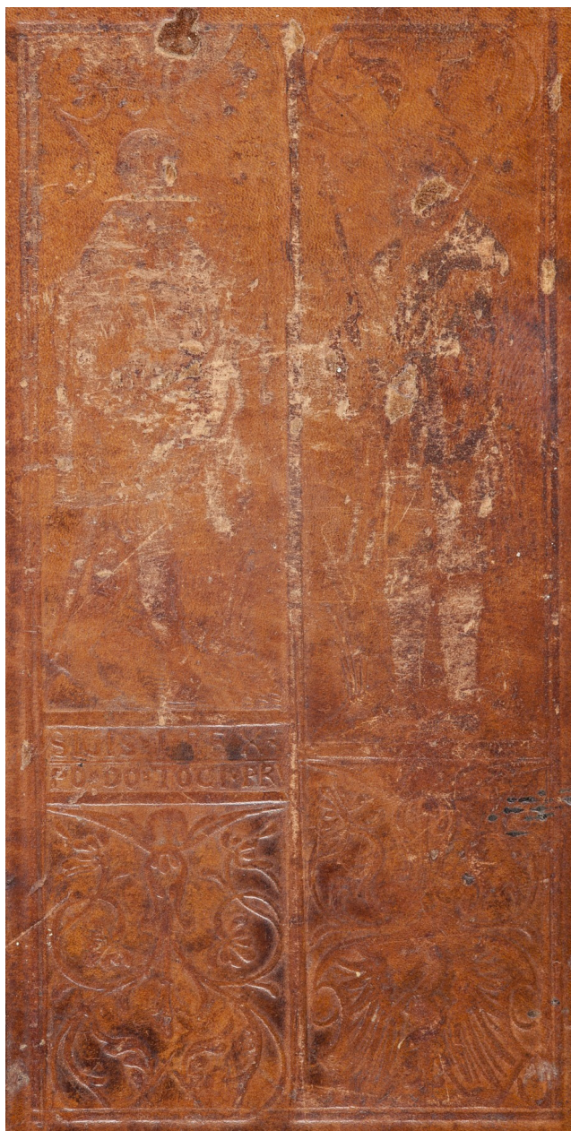
Il. 4. Wyciski pełnopostaciowego radełka jagiellońskiego na oprawie starodruków z 1540 i 1541 roku

sygn. VIII-16-1172- 1174.