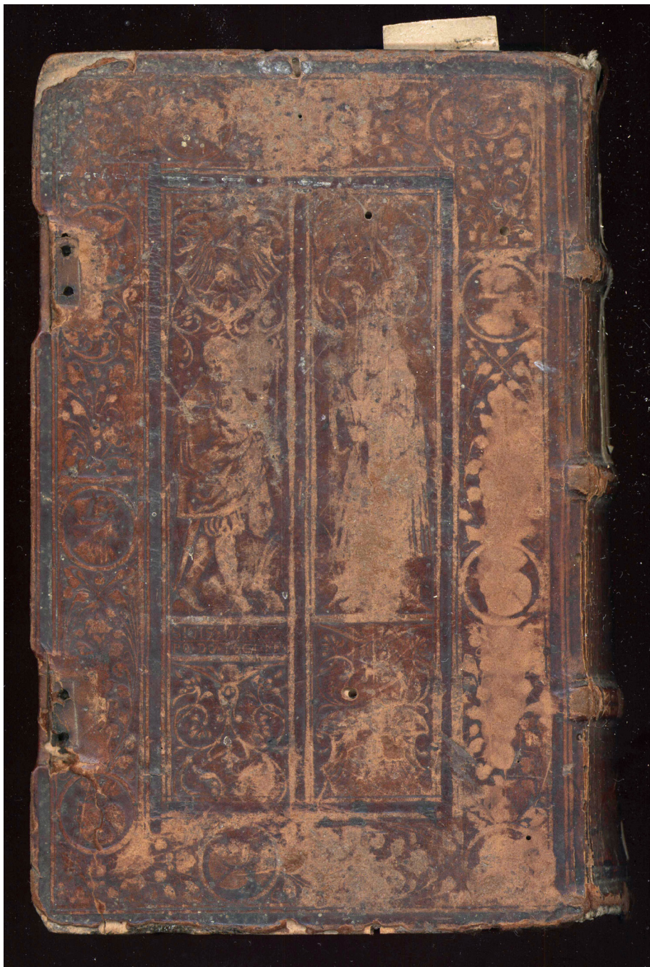
Il. 2. Dolna okładzina oprawy starodruku z 1535 roku