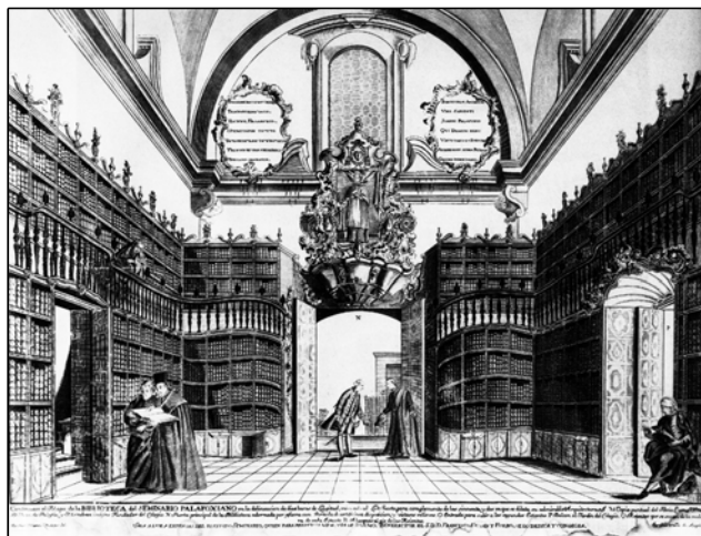
Rys. 1. Jose de Nava: Biblioteka Palafoxiana (1773)

na wstrząsy sejsmiczne; podjęto również działania mające na celu przywrócenie bibliotece jej dawnej, kolonialnej świetności. Konserwatorzy sztuki z Narodowego Instytutu Antropologii i Historii (Instituto Nacional de Antropología e Historia – INAH) w 2003 roku ukończyli restaurowanie szaf bibliotecznych. Prace objęły: uzupełnienie i wymianę uszkodzonych elementów drewnianych (drewno cedrowe zastąpiono sosnowym, bardziej odpornym na ataki insektów), konserwację wyposażenia i sprzętów naturalnymi preparatami oraz zabezpieczenie przed korozją metalowych elementów szaf; regały poziome trzeciego zostały na stałe przytwierdzone do ścian.