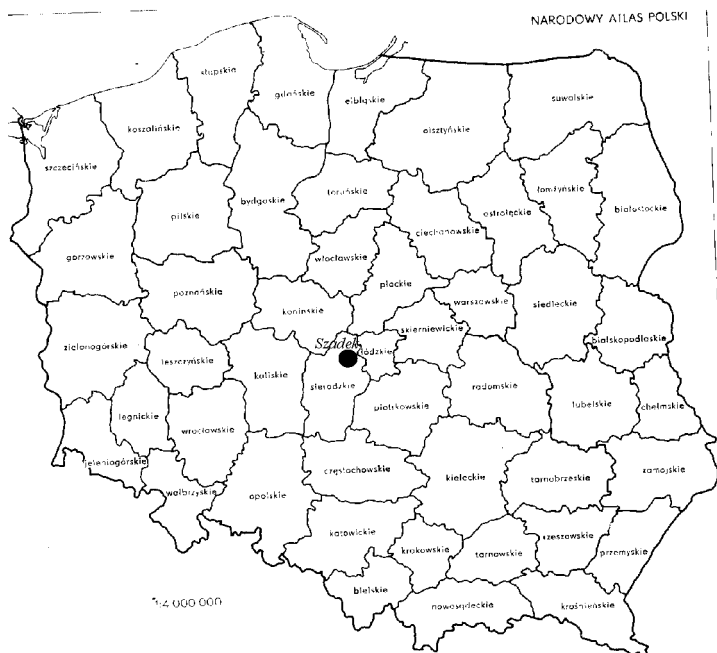
Rys. 4 Szadek po podziale administracyjnym Polski w 1975 r.

Gmina Szadek znalazła się ponownie w powiecie sieradzkim. Była ona położona przy wschodniej granicy powiatu, na krawędzi z powiatem łaskim. Pod względem podziałów specjalnych Szadek związany był z Sieradzem i w większości wypadków z Łodzią, będącą siedzibą władz wyższego szczebla administracji specjalnej. Szadek m.in. znalazł w Łódzkim Okręgu Wojskowym, podlegając pod Łódzką Izbę Skarbową, jednak pod względem podziału sądowego należał do Kaliskiego Okręgu Sądowego i Warszawskiego Okręgu Apelacyjnego. W tym okresie również zabrakło czynnika (np. przemysłu lub dogodnego połączenia komunikacyjnego) umożliwiającego rozwój miasta i napływ ludności, także w tym czasie ominęła go ważna droga Łódź-Pabianice-Łask-Sieradz.