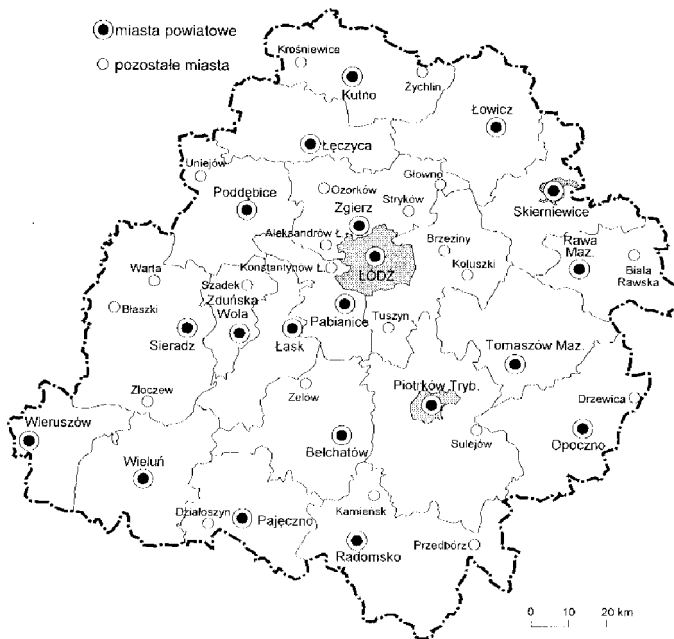
Rys. 5 Szadek w nowym województwie łódzkim