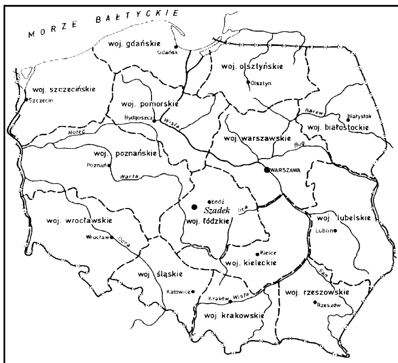
Rys. 3 Miejsce Szadku w podziale administracyjnym z lat 1946-50

W cztery lata po powstaniu styczniowym (1863 r.) doszło do kolejnych zmian administracyjnych tych ziem. Szadek znalazł się w odtworzonej guberni kaliskiej, będąc jednym z kilku miast powiatu sieradzkiego. Wówczas powstała nowa jednostka administracyjna najniższego szczebla (gmina), miasto stało się siedzibą gminy o tej samej nazwie oraz podobnie, jak większość małych miast utracił swe prawa miejskie w 1870 r.