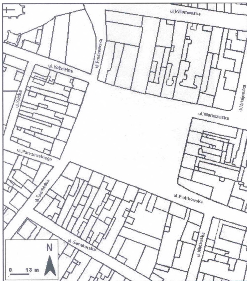
Rys. 2. Położenie rynku w przestrzeni miejskiej

prawdopodobne, że duże znaczenie przy planowaniu miasta miał fakt braku murów miejskich w Szadku, czego konsekwencją było dość duże „rozluźnienie” zabudowy oraz wymiary rynku. Biorąc pod uwagę układ przestrzenny miasta lokacyjnego, rynek stanowił rzeczywiste centrum, tak w sensie przestrzennym, jak i funkcjonalnym, koncentrując handel, komunikację oraz władzę. Wytyczony rynek przyjął początkowo wymiary 125 x 75 m (w przeliczeniu na powierzchnię 0,9 ha).