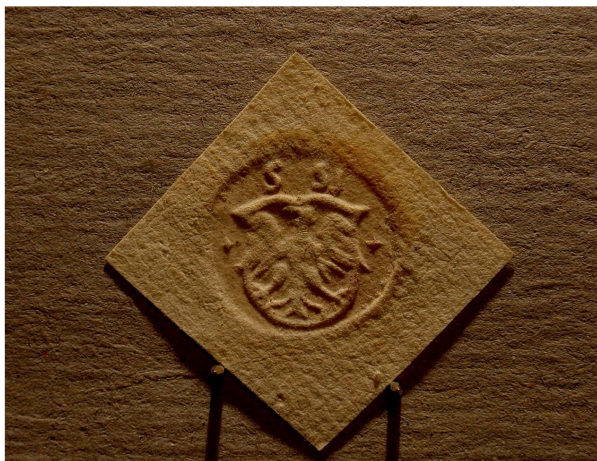
Fot. 2. Pieczęć z Orłem Białym niekoronowanym w renesansowej tarczy herbowej, wykorzystywana w Szadku od poł. XVI do poł. XVII w.

dokumentacją, wytwarzaną podczas posiedzeń sądów w Piotrkowie Trybunalskim 6 , Sieradzu 7 i Szadku 8 . Pieczęć z Orłem Białym niekoronowanym w renesansowej tarczy herbowej (fot. 2.) wykorzystywano w Szadku przynajmniej od 1553 9 aż do 1659 r. 10 Nie wiemy, jak długo pieczęć szesnastowieczna pozostawała w „służbie kancelaryjnej” sieradzkich sądów ziemskich, w tym również tych odbywanych w Szadku. Nie znamy też pieczęci, która mogła ją zastąpić. Pomiędzy ostatnim, znanym użyciem pieczęci szesnastowiecznej a pojawieniem się kolejnej pieczęci pozostaje luka blisko stu lat, nieoświetlona, jak dotąd, żadnym przekazem sfragistycznym.