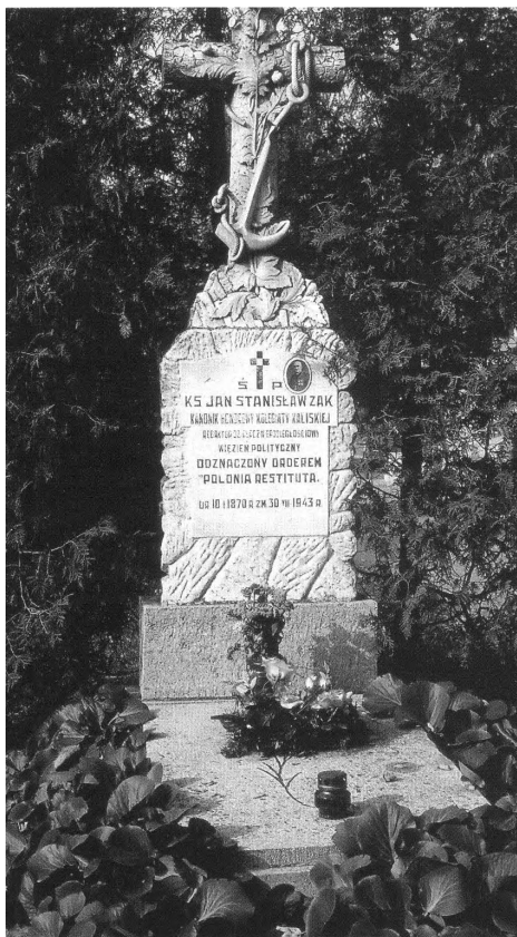
Fot. 4. Grób ks. Jana Stanisława Żaka na cmentarzu we Włocławku przy al. Chopina (kwatery 82)