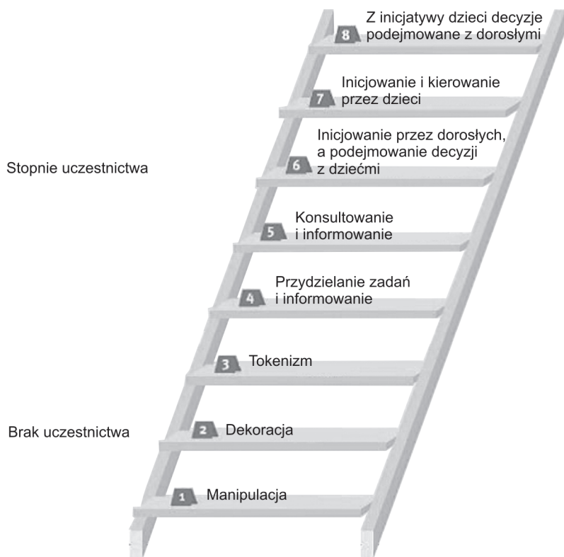
Rys. 1. Drabina poziomów uczestnictwa społecznego dzieci według Rogera Harta