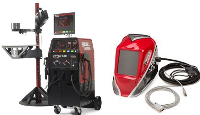
Rys. 2. Symulator spawalniczy VRTEX 360 ( www.vrtex360.com )

Przykładem wykorzystania VR w szkoleniach technicznych (inżynierskich) może być symulator spawalniczy VRTEX 360 firmy Lincoln Electric (rys. 2). Symulator spawalniczy VRTEX 360 daje możliwość nauki spawania, która prowadzona jest w warunkach imitujących rzeczywistość przemysłową. Podobieństwo wizualne symulatora do spawarki oraz imitacja uchwytów spawalniczych i elektrod w zakresie kształtów, wymiarów oraz ciężaru do ich rzeczywistych odpowiedników „urealnijają” zestaw symulacyjny. W zestawie dostępna jest również maska spawacza, w której ekran optyczny zastąpiony jest zestawem kamer i wizjera oraz zestawem dźwiękowym stereo, warunkujących sensoryczne zanurzenie operatora w symulowanym środowisku pracy.