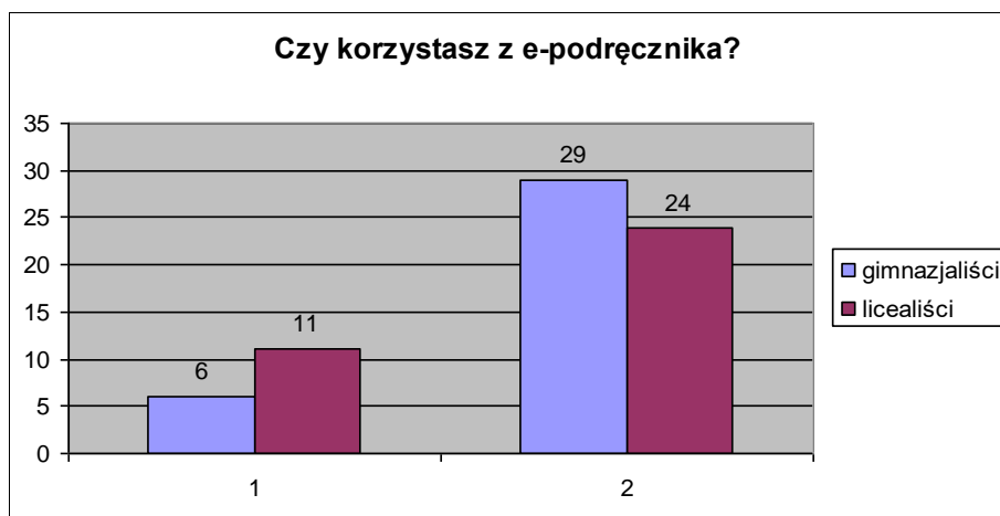
Rys. 1. Rozkład liczby osób korzystających z e-podręczników