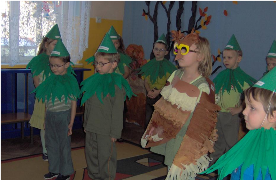
Pasowanie na przyjaciela przyrody

Uroczystości sprzyjają integracji dzieci, rodziców i personelu placówki. Również dzięki temu rodzice chętnie włączają się w akcje charytatywne organizowane w przedszkolu (m.in. zbiórkę słodyczy dla dzieci z domu dziecka, akcję Góra Grosza , zbiórkę karmy dla zwierząt ze schroniska); aktywnie uczestniczą w akcji Cała Polska czyta dzieciom .