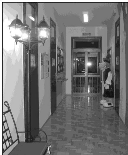
Zdjęcie 3. Planty – Miniwierzynek

Uwagę przyciąga współczesny fotoplastikon pokazujący kronikę wydarzeń przedszkolnych: ciekawych zajęć, spotkań z wyjątkowymi gośćmi, wycieczek i pielgrzymek, rodzinnych spotkań integracyjnych etc. Jest też biblioteczka dla rodziców. Zawiera, oprócz ciekawych pozycji książkowych, komplet przedszkolnych dokumentów (statut, regulaminy, procedury). Możemy w nich wyczytać między innymi, że realizowanie zadań przedszkola obejmuje wspieranie rodziny w wychowaniu dziecka, na wzór życia i miłości wzajemnej Najświętszej Rodziny. Celem wychowawczym przedszkola jest pełny rozwój dziecka jako osoby – w myśl zasad personalizmu i pedagogiki chrześcijańskiej.