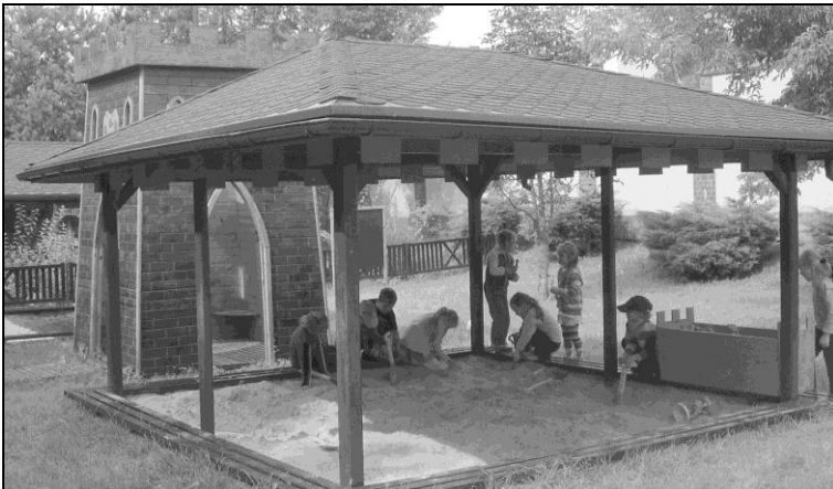
Zdjęcie 1. Barbakan w ogrodzie