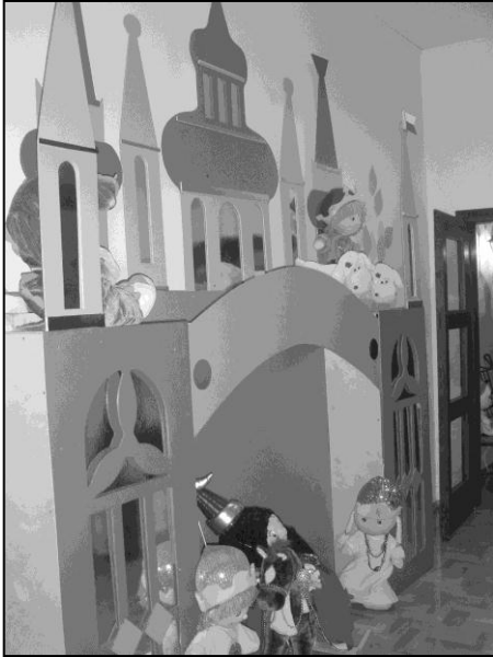
Zdjęcie 4. Szopka krakowska

PRZEZ PIĘKNO KU BOGU I PEŁNI CZŁOWIECZEŃSTWA. Fundamentem procesu edukacyjnego, realizowanego według tego programu, jest naturalne doświadczenie dziecka, które pozwala mu poznawać siebie i otaczający świat. Dziecko zdobywa owo doświadczenie poprzez kontakt z pięknem odkrywanym w świecie przyrody, kultury i wartości chrześcijańskich. Nośnikami tego piękna są: słowo, obraz, dźwięk, ruch, ważne wydarzenia, spotkania z Bogiem.