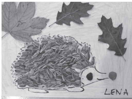
Fot. 3. Praca plastyczna wykonana przez 6-letnią dziewczynkę pt. „Jeż”