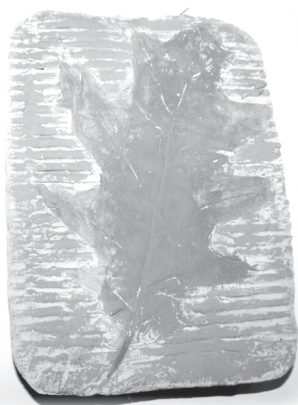
Fot. 2. Odbitka liścia w gipsie wykonana przez Kubę lat 6.

Przykłady innych prac plastycznych wykonanych przez dzieci w przedszkolu