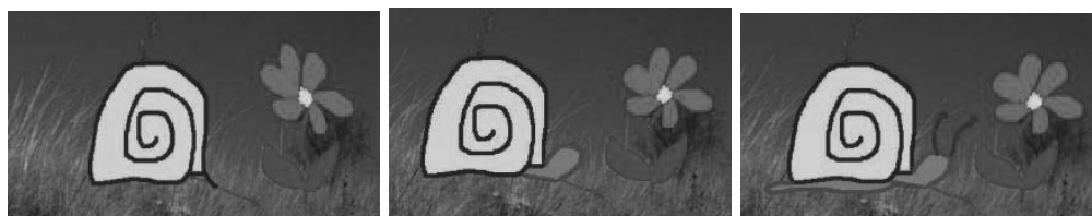
Obr. 1. Ukážka mini-projektu: Slimáčik Máčik

prostredia Imagine. Do obsahu piatich vyučovacích jednotiek sme vyčlenili, s ktorými elementmi prostredia Imagine sa budeme na jednotlivých cvičeniach zaoberať a na realizovanie akých aktivít ich budeme využívať. Tieto informácie sme vyjadrili v tabuľkovej forme. (Pozri ako príklad Tabuľka 1, ktorá obsahuje atribúty prvej vyučovacej jednotky). Na ilustráciu prvej aktivity z 1. cvičenia sme zvolili jednoduchú animáciu slimáčika Máčika (Obr. 1).