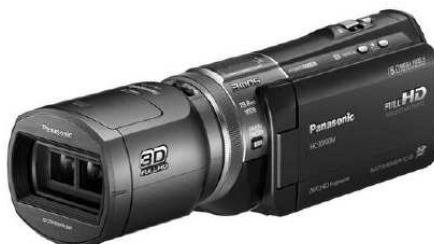
Rys. 2. Kamera z konwerterem 3D użyta do rejestrowania materiału wideo

Filmy zostały zrealizowane z wykorzystaniem metody side-by-side przeznaczonej dla okularów pasywnych. Do rejestracji materiału wideo użyto kamery 2D Panasonic HC-X900 z konwerterem 3D Panasonic VW-CIT2. Rozwiązanie takie daje możliwość zarejestrowanie obrazu 3D, który można oglądać na przystosowanych do tego celu telewizorach.