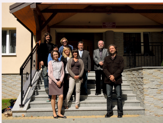
Wizyta w Hańczowej, fot.: arch. ZBEAT