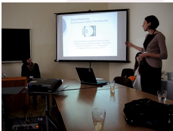
Konferencja w UMCS