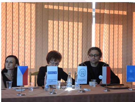
Konferencja w Zakopanem

czerwiec 2013 – członkowie Zespołu Badawczego w dniach 10–12 czerwca wzięli udział w Transdyscyplinarnym Sympozjum Badań Jakościowych w Łodzi. Uzyskane w ten sposób doświadczenia, wiedza i umiejętności przyczyniły się do podjęcia nowych wyzwań badawczych w zakresie możliwości wykorzystania podejścia jakościowego do eksploracji badawczych na gruncie edukacyjnej analizy transakcyjnej.