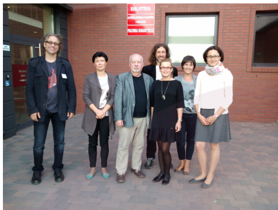
Konferencja PTDE