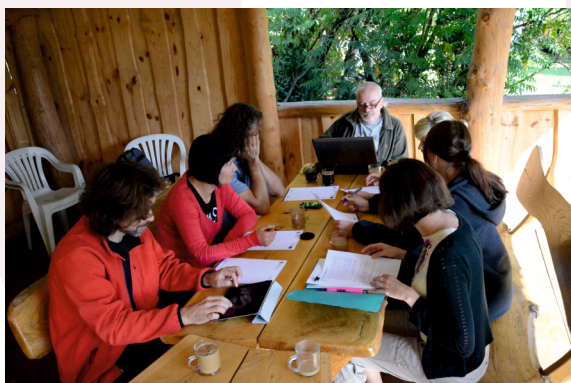
Seminarium w Bobolicach

wrzesień 2011 – 23–25 września 2011 r. odbyło się wyjazdowe seminarium naukowe Zespołu Badawczego Edukacyjnej Analizy Transakcyjnej w Bobolicach k. Częstochowy. Obrady poświęcono głównie projektom dalszych badań naukowych. Skupiono się również na propozycji wydawania stałego periodyku poświęconego analizie transakcyjnej – „Edukacyjna Analiza Transakcyjna” oraz na szeroko rozumianym wychowaniu i edukacji.