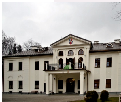
Konferencja w Cieszynie