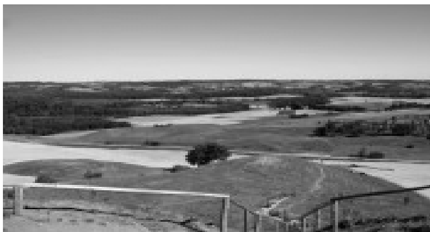
Rys. 2. Obszar przyrodniczo-krajobrazowy w Haćkach