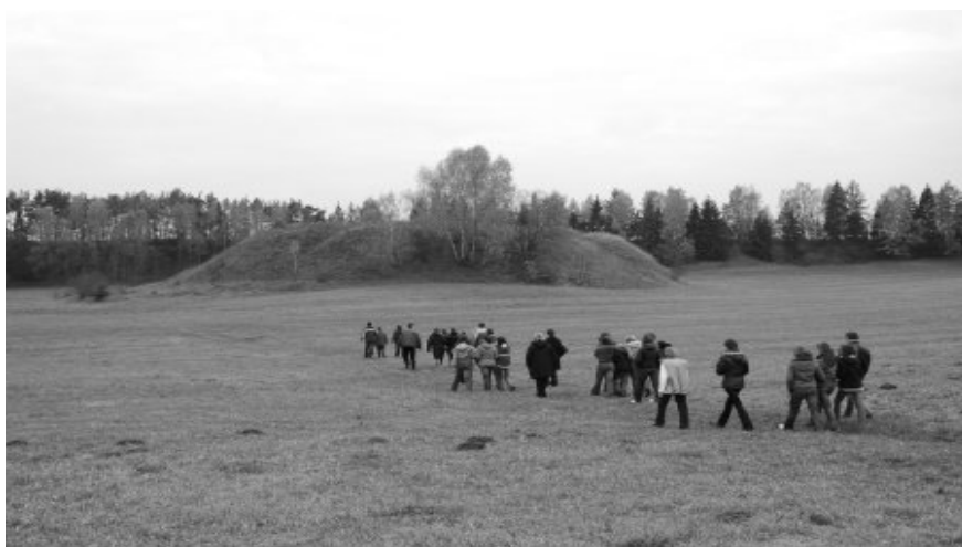
Rys. 1. Obszar przyrodniczo-krajobrazowy w Haćkach

micznych, ekstensywnie użytkowanych łąk, torfowisk przepływowych oraz łągów. Najlepiej zachowały się murawy kserotermiczne. Łąki kośne podlegają stopniowej degradacji w wyniku intensywnej gospodarki rolnej, podczas gdy obszar torfowiska przepływowego został wyłączony z użytkowania i szybko zarasta. Łągi charakteryzują się młodymi drzewostanami i uproszczonym składem gatunkowym runa (rysunki 1 i 2). Nadzór nad obszarem sprawuje Wojewódzki Konserwator Przyrody w Białymstoku.