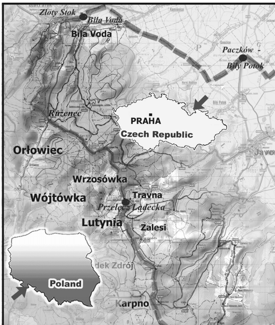
Rys 1. Terytorium badań