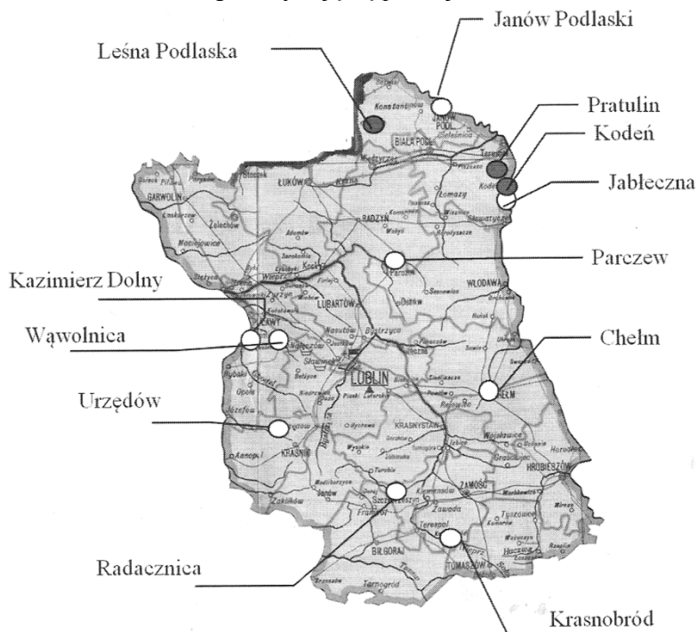
Rys. 4. Chrześcijańskie ośrodki pielgrzymkowe na terenie województwa lubelskiego (prawosławne i katolickie)

go. Dorocznie odpusty gromadziły w tym miejscu od kilku do kilkudziesięciu tysięcy pątników. Radecznicza zyskała miano „Częstochowy lubelskiej”. Okres zaborów, lata I i II wojny światowej oraz działania władz komunistycznych były dla Radeczniczy szczególnie trudne. Zlikwidowano zakon, kościół zamieniono w cerkiew, a z czasem sprowadzono mnichów. Nastąpiło też znaczne zmniejszenie ruchu pielgrzymkowego do sanktuarium. Ponowne wzmożenie ruchu nastąpiło dopiero w dwudziestoleciu międzywojennym. W latach 30. XX w. do sanktuarium przybywało od 70 do 100 tys. pielgrzymów rocznie. Z czasem sytuacja sanktuarium normalizowała się. Aktualnie sanktuarium w Radeczniczy należy do jednego z najważniejszych ośrodków kultu św. Antoniego w Polsce i gromadzi ponad 100 tys. wiernych rocznie. Z roku na rok odpusty stają się coraz liczniejsze, ożywiają się uroczystości, w Lasku św. Antoniego odbywają się procesje 18 .