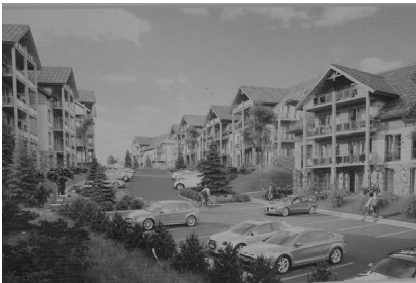
Rys. 3. Fragment billboardu reklamującego inwestycję „Apartamenty Czarna Góra”