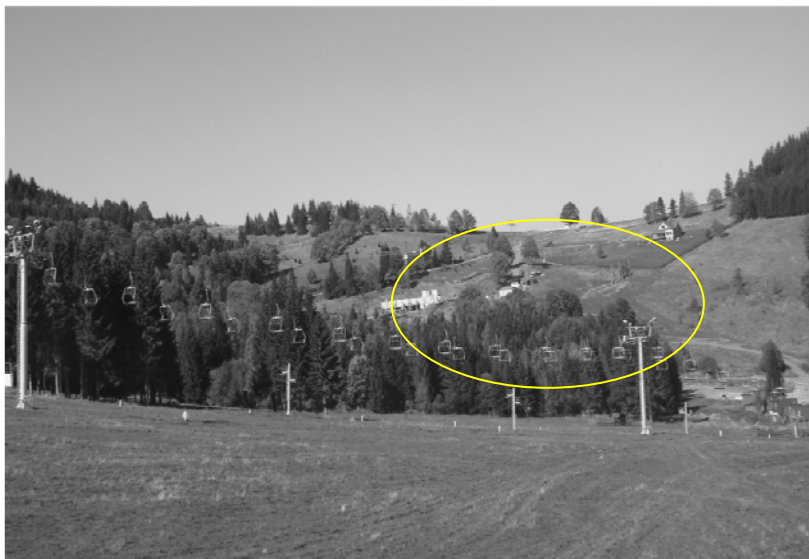
Rys. 2. Stacja narciarska „Czarna Góra” z widocznym rozpoczętym pierwszym etapem inwestycji, stan z września 2011 roku.