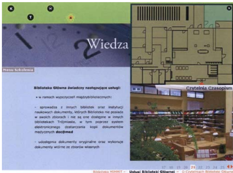
Ryc. 3. Interaktywny plan Biblioteki Głównej AMG ( http://biblioteka.amg.gda.pl/szkolenie )

Szkolenie kończy się testem sprawdzającym, zawierającym 20 zamkniętych pytań dających możliwość uzyskania maksymalnie 20 punktów. Niektóre z nich mają formę ćwiczeń i wymagają praktycznego wykorzystania katalogu VIRTUA. Test dostępny jest tylko dla studentów I roku AMG, po zalogowaniu się przez podanie imienia, nazwiska i numeru albumu. Jego zaliczenie następuje w momencie udzielenia ponad 50% pozytywnych odpowiedzi. Osoba, która uzupełniła test i dołączyła do niego ankietę, wysyła je do bazy otrzymując finalnie informację o zaliczeniu bądź nie zaliczeniu szkolenia. W tym ostatnim przypadku ma możliwość ponownego przystąpienia do testu i powtarzania go aż do skutku. Uzyskane przez poszczególne osoby wyniki, data odbycia szkolenia oraz ilość podjętych prób w celu zaliczenia testu, zapisywane są w specjalnie do tego celu stworzonej bazie, dostępnej tylko dla uprawnionych bibliotekarzy i stanowią podstawę dokonania wpisu do indeksu i wygenerowania protokołów egzaminacyjnych.