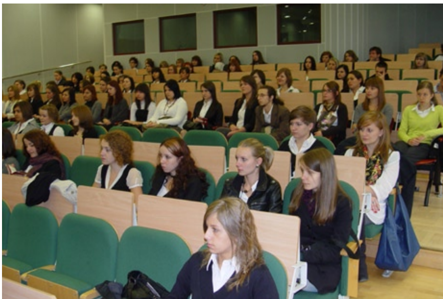
Inauguracja roku akademickiego 2010 / 2011