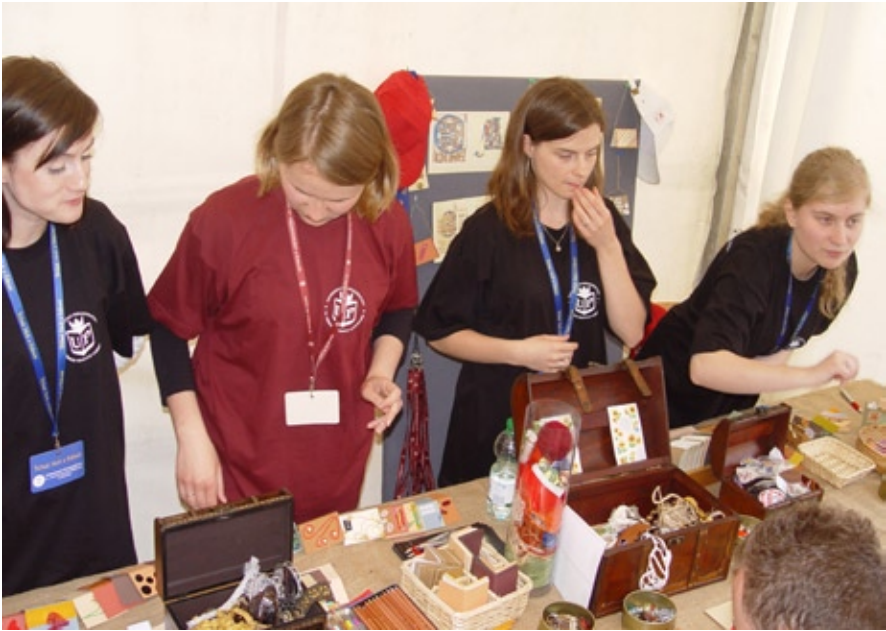
Festiwal Nauki 2010