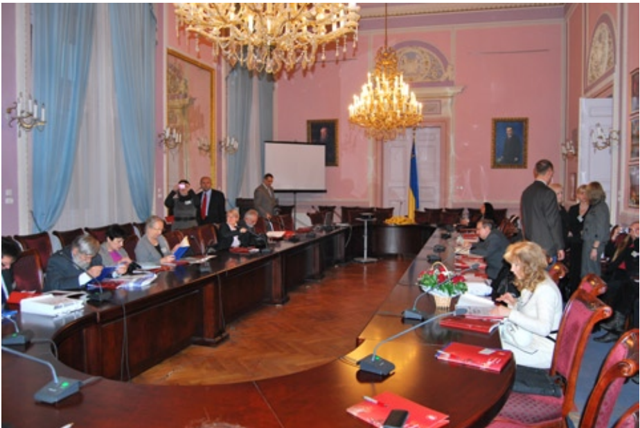
Konferencja Kraków - Lwów 2009