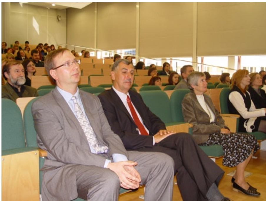
Inauguracja roku akademickiego 2012 / 2013