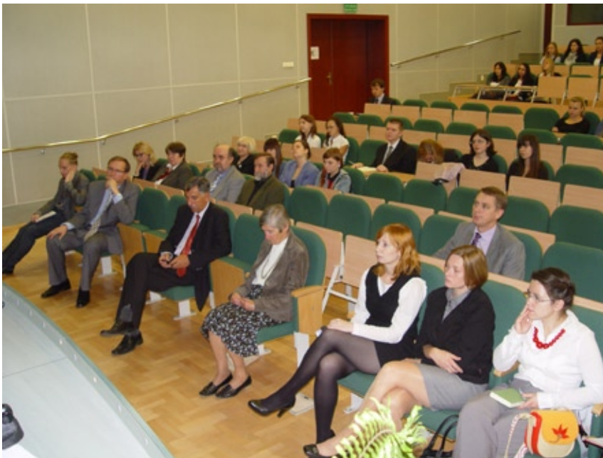
Inauguracja roku akademickiego 2012 / 2013