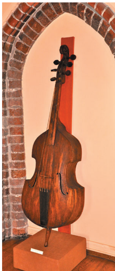
Ryc. 2. Violone – instrument ocalały po jezuickiej kapeli z Otnia. Muzeum Instrumentów Muzycznych w Poznaniu, MNP I-83.

Celem prac w obu wypadkach będzie ustalenie losów kolekcji po kasacji tych klasztorów oraz opracowanie ich katalogów. Pracami tymi zajmuje się cały zespół.